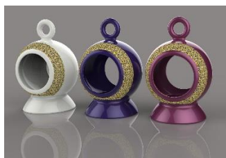
ภาพที่ 2 รูปแบบที่ 5 โคมไฟหรือตะเกียง

พบว่าความคิดเห็นของผู้เชี่ยวชาญที่มีต่อรูปแบบของผลิตภัณฑ์สินค้าประเภทของที่ระลึกเบญจรงค์ทั้ง 5 รูปแบบ โดยภาพรวมคุณลักษณะด้านรูปแบบของผลิตภัณฑ์สินค้าประเภทของที่ระลึกทั้ง 4 ด้าน ได้แก่ ความแข็งแรงของโครงสร้าง ความสะดวกสบายในการใช้ ความสวยงาม ความเหมาะสมกับผลิตภัณฑ์ ลำดับที่ 1 ได้แก่ รูปแบบที่ 5 มีความเหมาะสมอยู่ในระดับมาก ( \bar{X} = 4.37 ) ส่วนเบี่ยงเบนมาตรฐาน 0.77