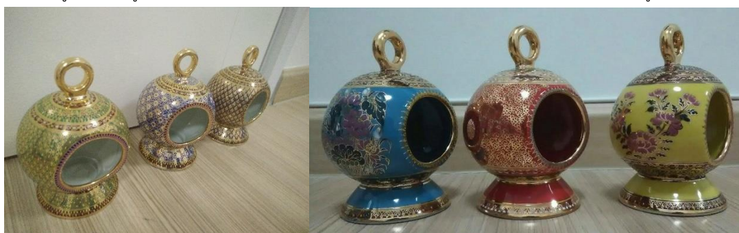
ภาพที่ 3 โคมไฟหรือตะเกียงที่ผลิตขึ้นใหม่สำหรับใช้ประเมินความพึงพอใจของผู้บริโภค

ในส่วนนี้ผู้วิจัยได้นำรูปแบบจากการประเมินความเหมาะสม นำมาผลิตสินค้าประเภทของที่ระลึกหมู่บ้านเบญจรงค์