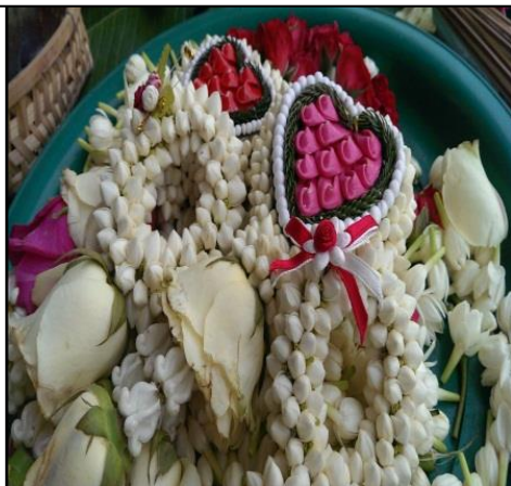
ภาพที่ 5 พวงมาลัยจากดอกมะลิและดอกพุดเล็ก ซึ่งเป็นดอกไม้ที่ปลูกและเก็บเองได้ภายในพื้นที่ไร่ของคุณรุจิรา มีการใส่ตามาลัยรูปหัวใจและติดโบรูปกุหลาบเพื่อเพิ่มคุณค่าและมูลค่าให้กับพวงมาลัย