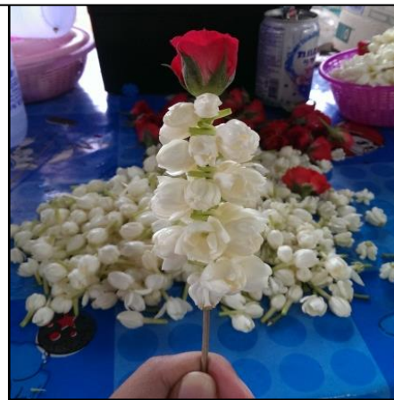
ภาพที่ 6 มะลิเสียบไม้ที่ผู้วิจัยได้ทำ ซึ่งวัดตูดิบสามารถหาได้ในท้องถิ่น ได้แก่ ไม้ไผ่เหลาปลายแหลม ดอกกรัก ดอกมะลิ และกุหลาบมอญ มะลิเสียบไม้เป็นที่นิยมมาก เพราะผู้สูงอายุชื่นชอบกลิ่นหอมของมะลินั่นเอง