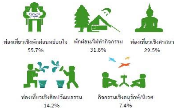
รูปที่ 2 ร้อยละของประชากรที่มีอายุ 15 ปีขึ้นไปเดินทางท่องเที่ยว จำแนกตามกิจกรรมที่ทำระหว่างเดินทางท่องเที่ยว 5 อันดับแรกในรอบปี 2558