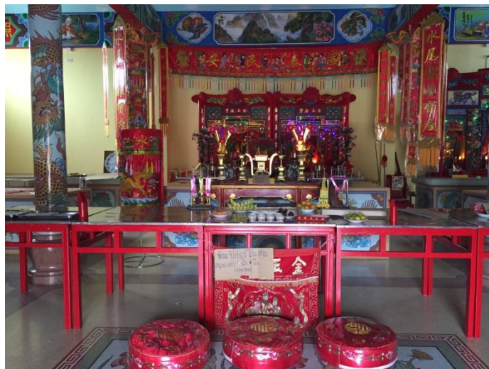
รูปที่ 3 ศาลเจ้าแม่ทับทิม เทศบาลตำบลท่ายาง ผู้คนที่นับถือจะมาราบไหว้บูชาและเสี่ยงเซียมซีขอเลขเด็ดจากเจ้าแม่