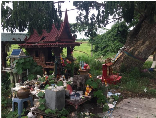
รูปที่ 2 ศาลและต้นไม้ศักดิ์สิทธิ์ที่มีผู้นำผ้าสามสีไปผูกและนำชุดไทยไปถวาย บริเวณข้างทางก่อนถึงโรงเรียนท่ายางวิทยาประมาณ 100 เมตร