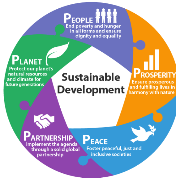
รูปที่ 2 : หลักการ 5 Ps

ร่วมในการมุ่งขจัดความยากจนของประชากรโลกทั้งสิ้น 836 ล้านคนทั่วโลกให้หมดสิ้นไปภายในปี 2573 การขจัดความยากจนและการพัฒนาที่ยั่งยืน ภายใต้หลักการ 5 Ps ได้แก่ ประชาชน (People) โลก (Planet) ความมั่งคั่ง (Prosperity) สันติภาพ (Peace) และความเป็นหุ้นส่วน (Partnership)