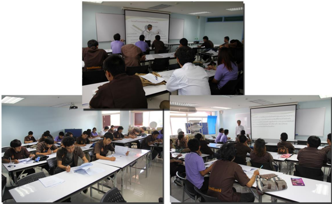
รูปที่ 3 การนำชุดการสอนแบบสื่อประสมไปใช้กับกลุ่มตัวอย่าง

2.3 ทดสอบหลังเรียน (Post-test) เมื่อนักศึกษาผ่านการเรียนครบบทเรียนแล้ว ทำการทดสอบผลการเรียนอีกครั้งด้วยแบบทดสอบวัดผลสัมฤทธิ์ทางการเรียน ซึ่งเป็นแบบทดสอบฉบับเดียวกับแบบทดสอบก่อนเรียน