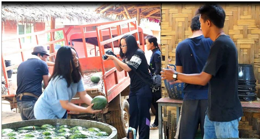
ภาพที่ 1 ขั้นตอนการถ่ายทำ ณ Elephant Haven Thailand จังหวัดกาญจนบุรี

2.3.3 ขั้นตอนการลงพื้นที่เพื่อถ่ายทำวีดิทัศน์ ณ โครงการ Elephant Haven Thailand จังหวัดกาญจนบุรี โดยการถ่ายทำในครั้งนี้เป็นไปตามแผนที่วางไว้ เริ่มจากการเข้าพูดคุยกับเจ้าหน้าที่ล่วงหน้า จากนั้นวันต่อมาจึงเริ่มถ่ายทำจริง เริ่มที่การถ่ายทำการปฏิบัติงานของเจ้าหน้าที่ในช่วงเช้า กิจกรรมต่างๆที่นักท่องเที่ยวทำร่วมกับช้าง สัมภาษณ์ความรู้สึก ความประทับใจของนักท่องเที่ยว และสุดท้ายสัมภาษณ์ไกด์ของโครงการ Elephant Haven Thailand