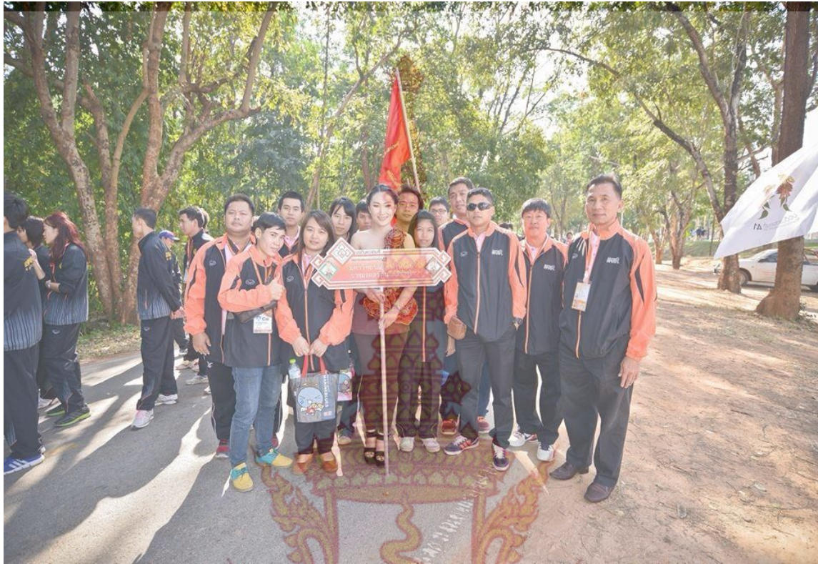
ภาพที่ 2 นักกีฬาและผู้ฝึกสอนเข้าร่วมพิธีเปิดการแข่งขัน