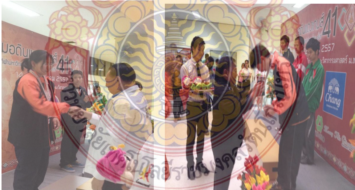
ภาพที่ 3 นักกีฬาหมากรุกไทยได้รับเหรียญเงิน