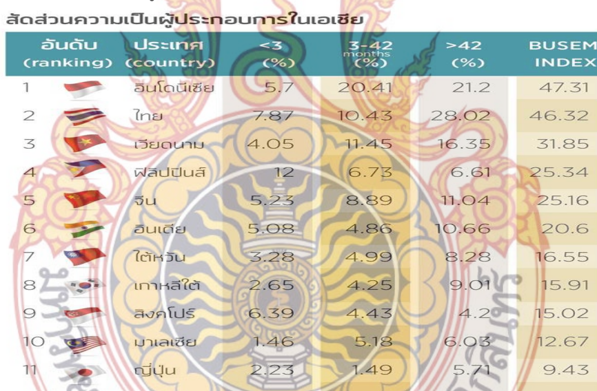
ตารางที่ 1 สัดส่วนความเป็นผู้ประกอบการในเอเชีย