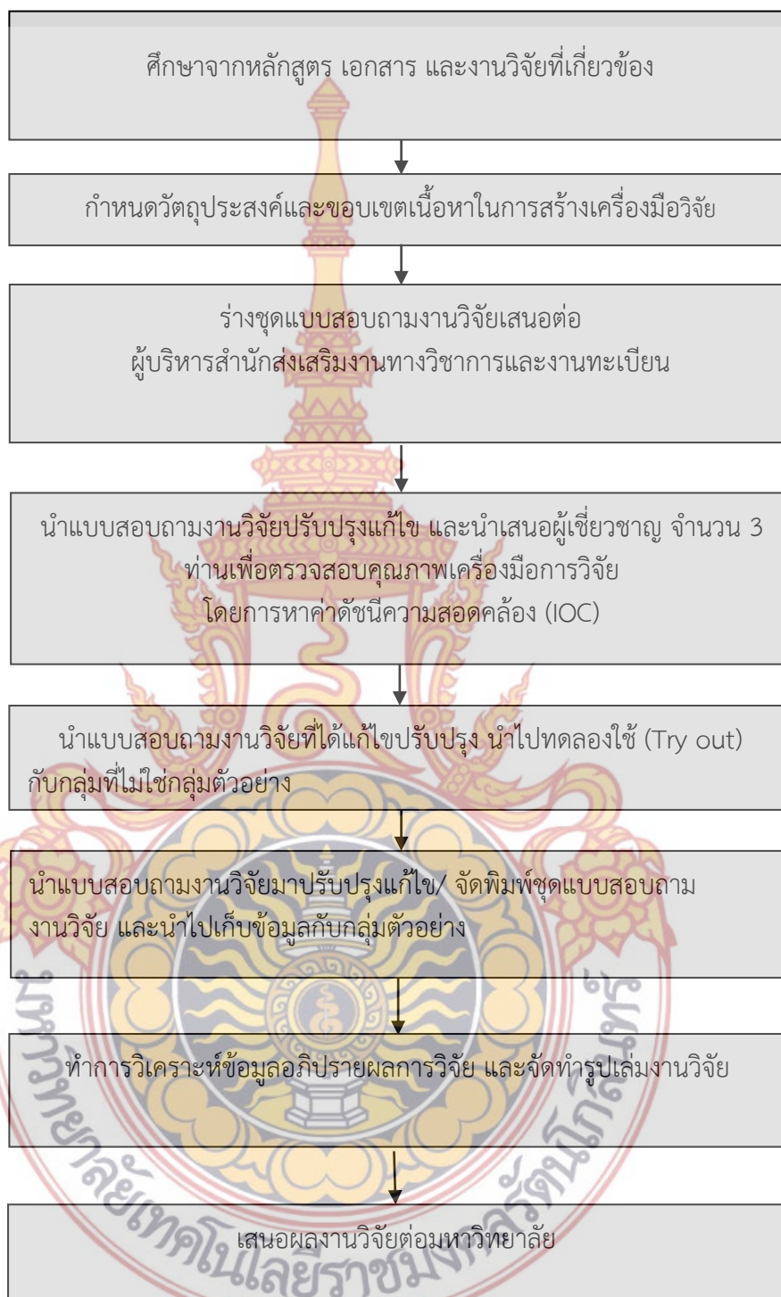
ภาพที่ 3-1 แสดงขั้นตอนการสร้างแบบสอบถามงานวิจัย