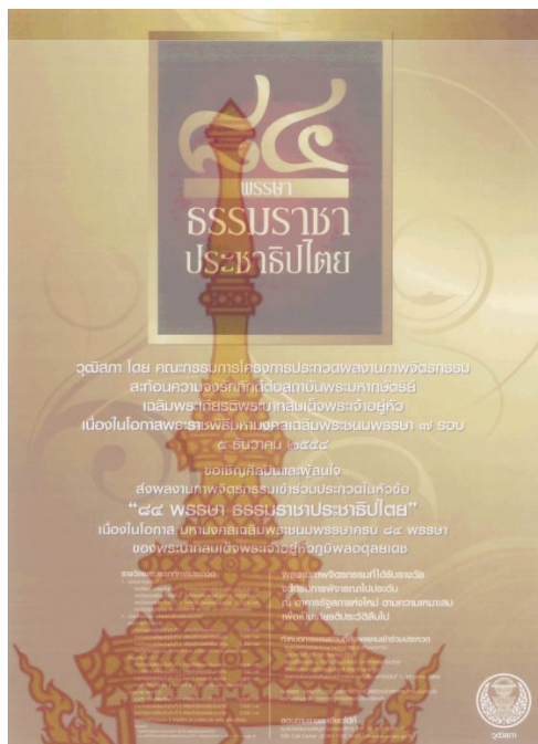
ภาพที่ 4 ใบประกาศ ประชาสัมพันธ์งานประกวดจิตรกรรม ข้อมูลที่ใช้ในการสร้างสรรค์