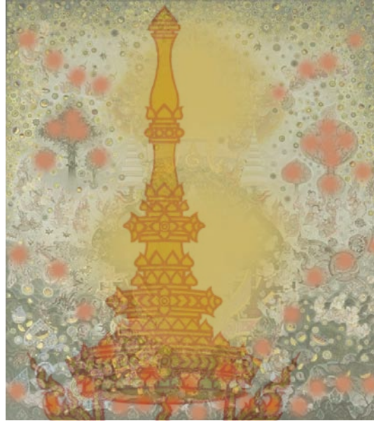
ภาพที่ 24 วิเคราะห์กลุ่มรูปทรงใหญ่ร่วมกับรูปทรงขนาดย่อย