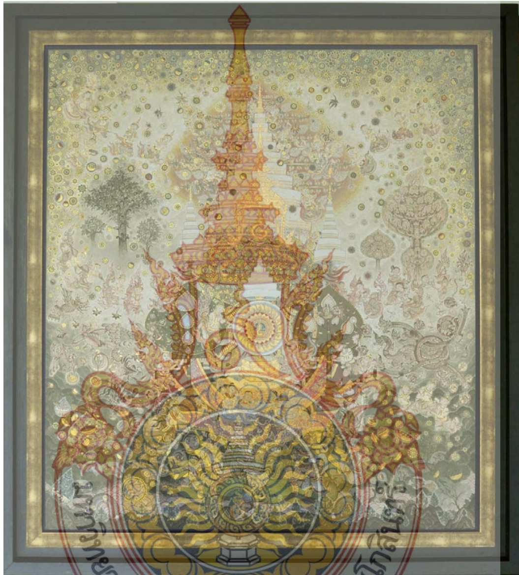
ภาพที่ 13 ชื่องาน พระผู้เป็นที่รักแห่งแผ่นดิน 140 x 160 เซนติเมตร , สีอะครีลิคบนผ้าไหม