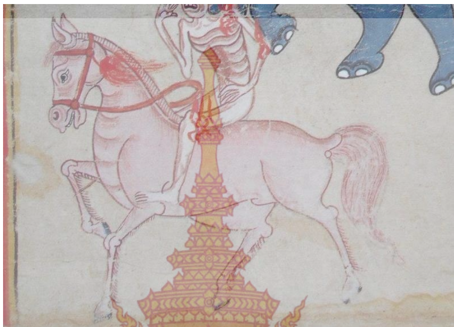
ภาพที่ 6 อธิพิพลที่ได้จากงานจิตรกรรมสมัยอยุธยา สมุดภาพไตรภูมิ ข้อมูลที่ใช้ในการสร้างสรรค์