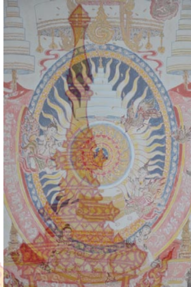
ภาพที่ 22 วิเคราะห์บริเวณจุดเด่น