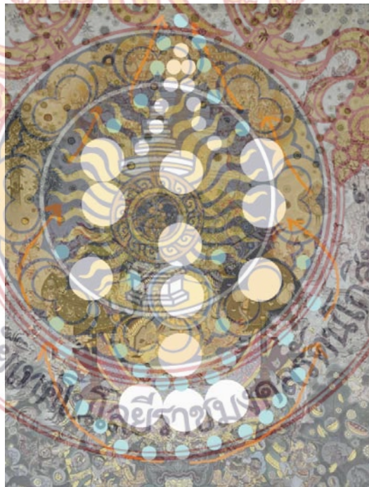
ภาพที่ 23 วิเคราะห์กลุ่มรูปทรงใหญ่