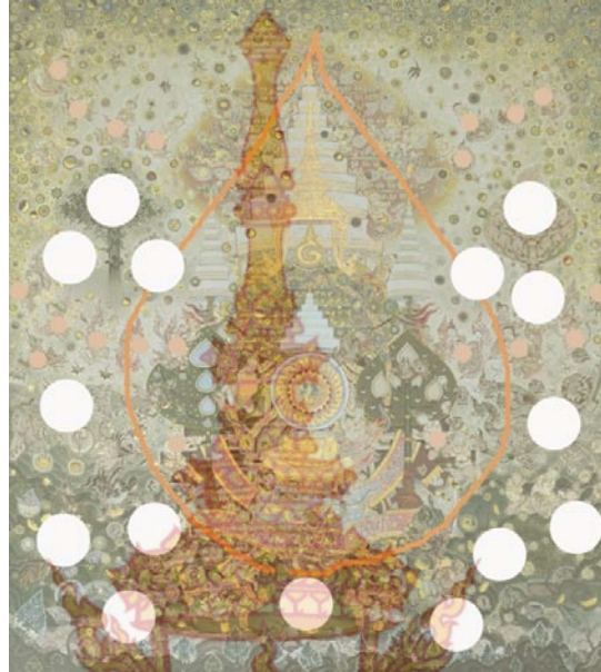
ภาพที่ 18 วิเคราะห์โครงสร้างของกลุ่มย่อย ฉากหลัง