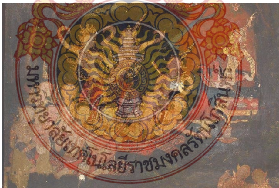
ภาพที่ 5 อธิพิลที่ได้จากงานศิลปกรรมโบราณสมัยรัตนโกสินทร์ พระที่นั่งพุทไธสวรรย์