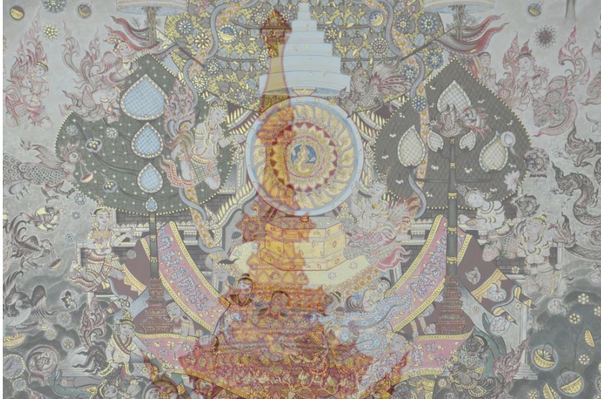
ภาพที่ 14 รายละเอียดผลงาน พระผู้เป็นที่รักแห่งแผ่นดิน