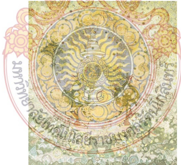
ภาพที่ 21 วิเคราะห์ค่าความสว่างบริเวณจุดเด่น