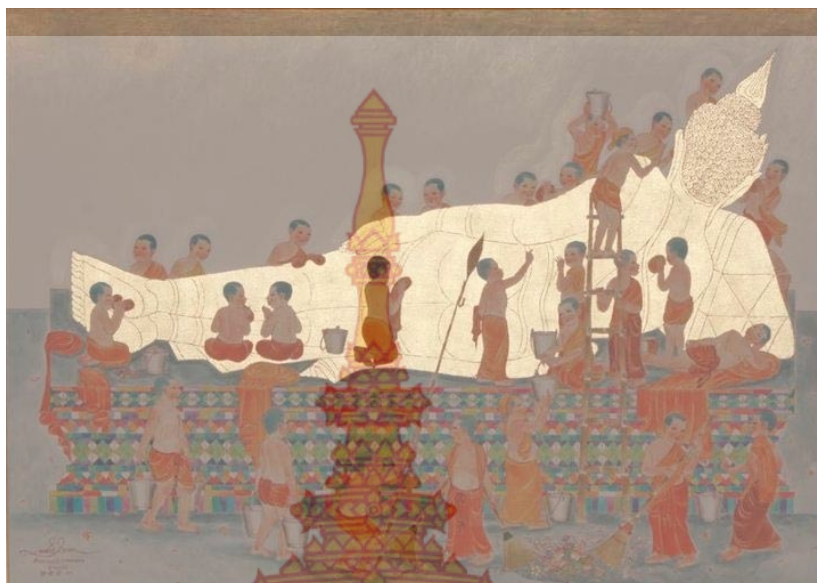
ภาพที่ 8 อธิพลที่ได้จากภาพจิตรกรรมร่วมสมัย ( พรชัย ใจมา , ทำความสะอาด , ขนาด 150 x 200 cm , สีฝุ่นบนผ้าใบ )