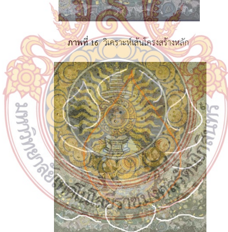
ภาพที่ 17 วิเคราะห์เส้นโครงสร้างรอง