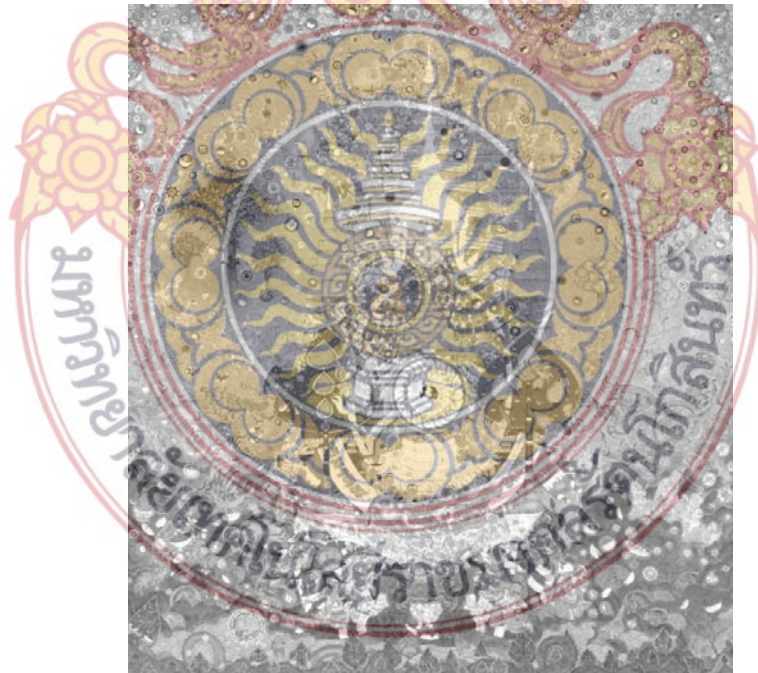
ภาพที่ 19 วิเคราะห์น้ำหนักเข้ม-อ่อน