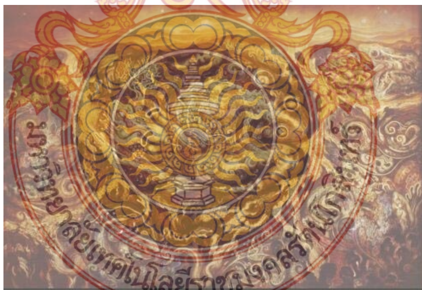
ภาพที่ 7 อธิพิพลที่ได้จากภาพจิตรกรรมร่วมสมัย ( เบญจรงค์ โควาทักษะเทศ , วัฏจักรในธรรมชาติ , ขนาด 150 x 200 cm , สีอะครีลิคบนผ้าใบ )