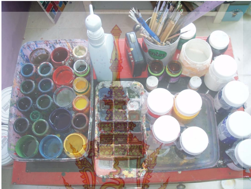
ภาพที่ 10 วัสดุอุปกรณ์ในการสร้างสรรค์ สีอะครีลิค พู่กัน จานสี สะพานรองมือ