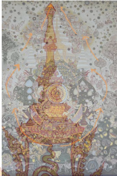
ภาพที่ 16 วิเคราะห์เส้นโครงสร้างหลัก