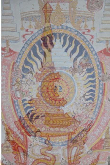
ภาพที่ 11 ภาพผลงานขณะสร้างสรรค์ตราสัญลักษณ์