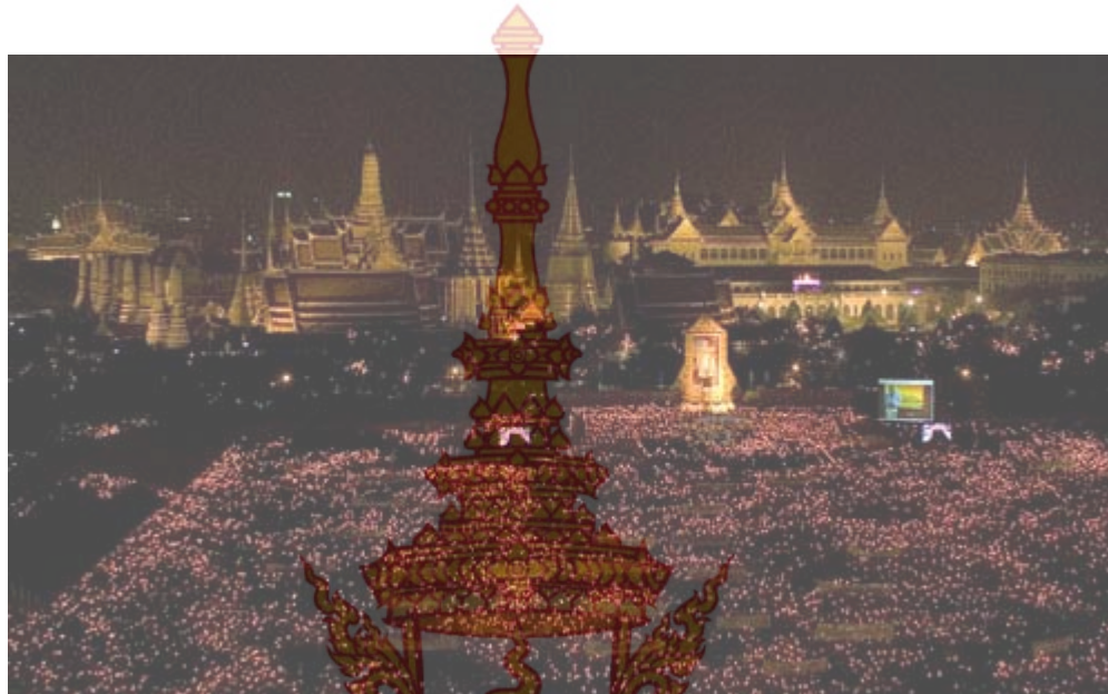
ภาพที่ 2 พิธีถวายเครื่องราชสักการะและจุดเทียนชัยถวายพระพร ข้อมูลที่ใช้ในการสร้างสรรค์