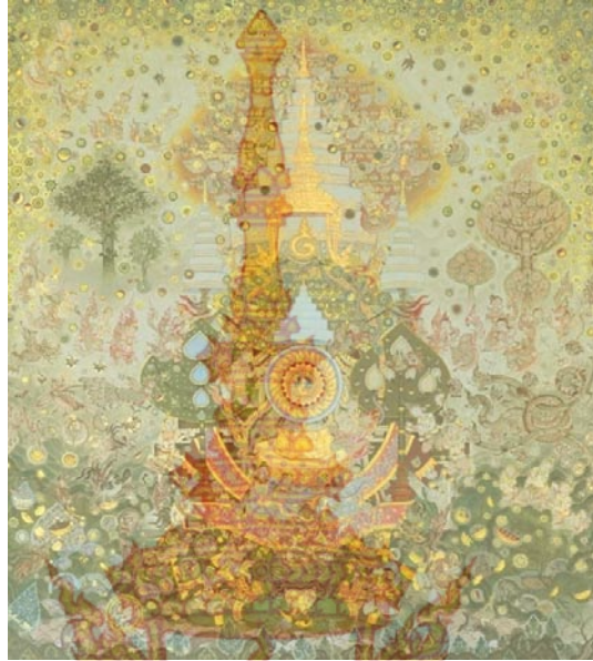
ภาพที่ 20 วิเคราะห์ค่าความสดของสี