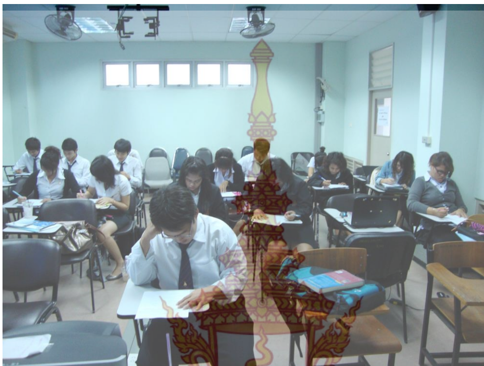
ภาพที่ 1 ภาพกิจกรรมของนักศึกษากลุ่มตัวอย่างตอบแบบสอบถาม