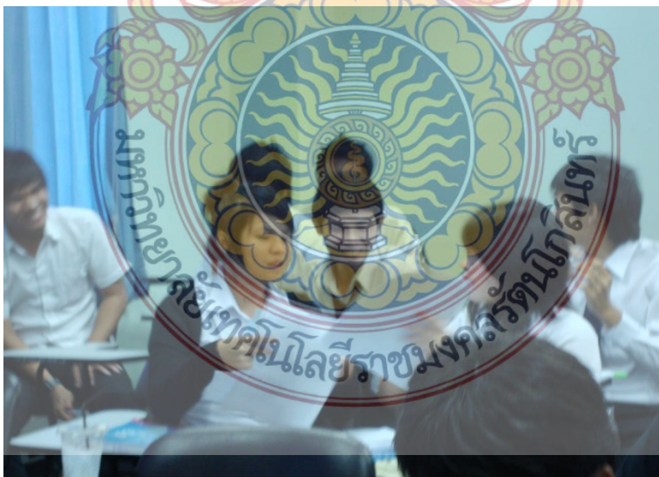
ภาพที่ 2 ภาพกิจกรรมของนักศึกษากลุ่มตัวอย่างตอบแบบสอบถาม