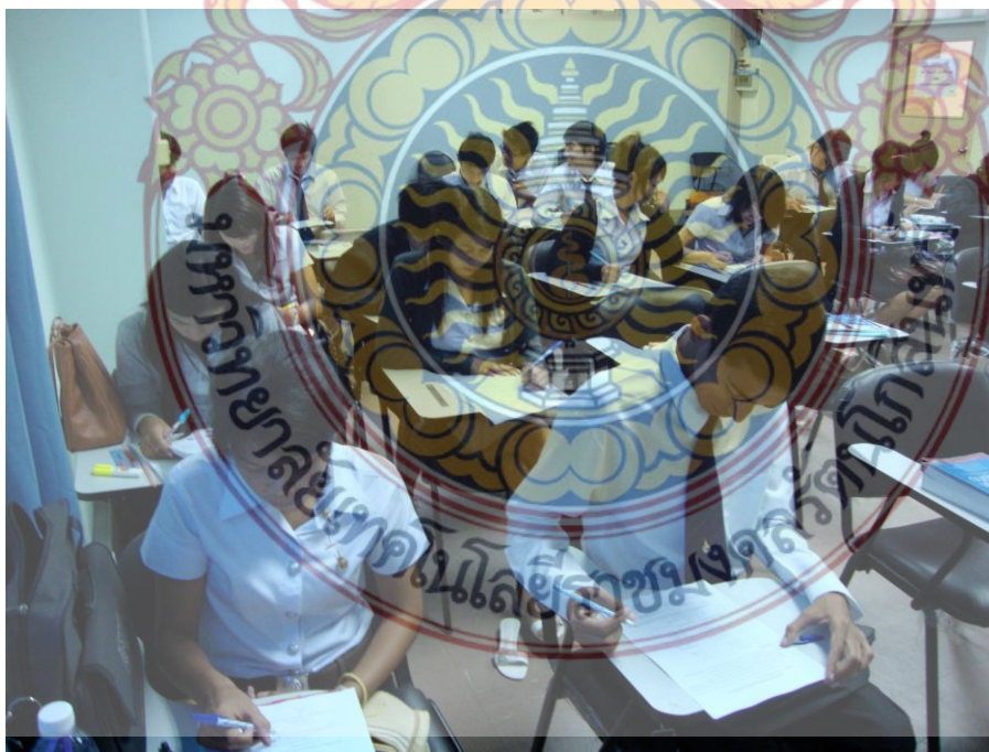
ภาพที่ 4 ภาพกิจกรรมของนักศึกษาในกลุ่มตัวอย่างตอบแบบสอบถาม