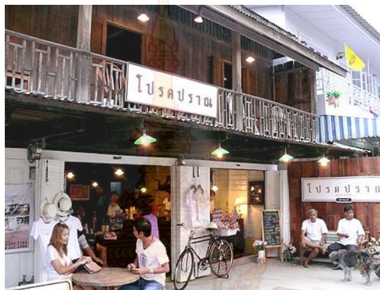
ภาพที่ 2 โปรดปรานร้านอันเป็นที่โปรดปรานของนักท่องเที่ยวนักท่องเที่ยว

มีร้านกาแฟ “โปรดปราน” กับร้าน “บ้านอาม่า” สองร้านใกล้ๆ กันที่เป็นทั้งจุดถ่ายรูปสำคัญแก่นักท่องเที่ยว เพราะทั้ง 2 ร้านสามารถนำเรือเก่ามาตกแต่งจัดแสดงข้าวของเครื่องใช้ผสมผสานระหว่างความเก่ากับใหม่ได้อย่างน่าชม