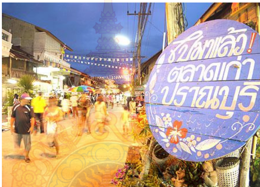
ภาพที่ 1 บรรยากาศบริเวณถนนคนเดินของตลาดเก่าปราจีนบุรี

อำเภอปราจีนบุรี จังหวัดประจวบคีรีขันธ์ ก่อนที่จะกลายมาเป็นเมืองท่องเที่ยวทางทะเลชื่อดังในปัจจุบัน เมืองนี้เป็นเมืองโบราณปรากฏชื่อเมืองชัดเจนมาตั้งแต่สมัยกรุงศรีอยุธยา