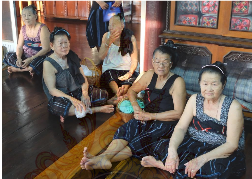
ภาพที่ 3.1 การเก็บรวบรวมข้อมูลจากกลุ่มผู้สูงอายุ