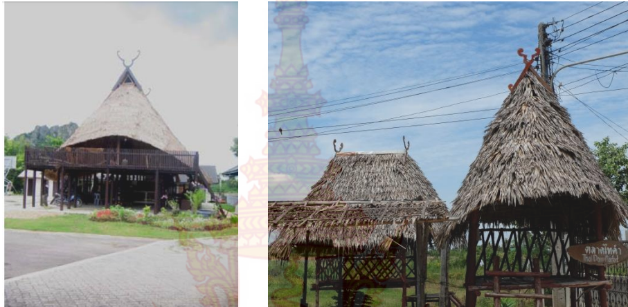
ภาพที่ 4.1 ลักษณะบ้านไทยทรงดำในอดีต