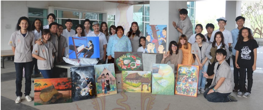
ภาพที่ 6.2 ผลงานนักศึกษาในหัวข้อ “ถอดชีวิตจากภาพ ทราบเรื่องราวไททรงดำ กำแพงแสน”

2. หนังสือ จำนวน 1 เล่ม ได้แก่ คู่มือการท่องเที่ยวเชิงวัฒนธรรมไททรงดำบ้านสระสีมูม