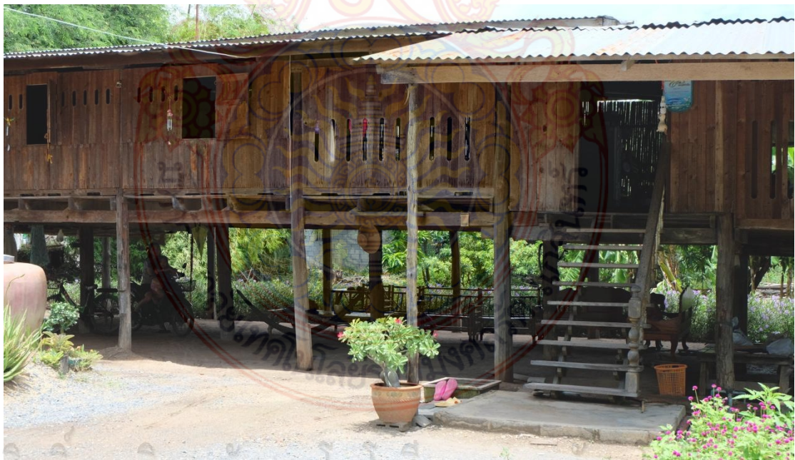
ภาพที่ 4.2 ลักษณะบ้านไทยทรงดำในปัจจุบัน