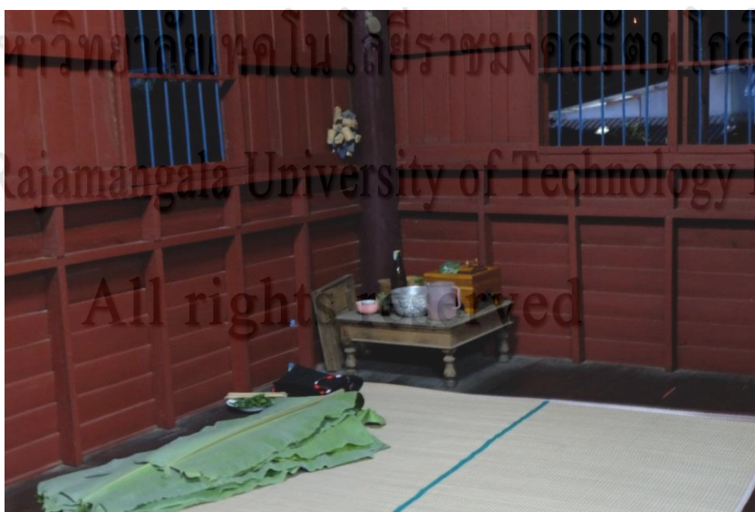
ภาพที่ 4.4 กะล๋อห้อง

1. ผีเรือน หรือ ผีเฮือน คือ ผีปู่ย่าและผีพ่อแม่ ตลอดจนผีพี่น้องของปู่และพ่อ ที่ได้รับการเชิญให้ขึ้นมาอยู่ในบ้านเรือนของลูกหลานที่กะล๋อห้อง การตายของญาติ (หว่าสัง) คนในวงศ์ตระกูลเดียวกัน เป็นเพียงการตายของร่างกายหยาบ (กิง) แต่วิญญาณของผู้ตาย (ผีขวัญ) ยังคงเหลืออยู่ มีความผูกพันกับลูกหลานที่ยังมีชีวิตอยู่ เหมือนกับตอนที่ยังมีชีวิตอยู่ จึงเป็นเหตุผลว่าเมื่อบุคคลในครอบครัว โดยเฉพาะพ่อแม่ ตายแบบ “ตายดี” ผีขวัญหรือผีวิญญาณของพวกท่าน จึงมิได้ถูกปล่อยทิ้ง แต่ลูกหลานจะเชิญให้ขึ้นมาอยู่บนบ้านและเป็นใหญ่ในบ้านในฐานะ “ผีเฮือน” เพื่อดูแลปกป้องตนเองและครอบครัว เชื่อกันว่า ผีเฮือนสามารถช่วยปกป้องคุ้มครองลูกหลานและบันดาลให้เกิดความเจริญรุ่งเรืองแก่ชีวิตของลูกหลานได้ ถ้าหากได้รับการนับถือ เอาใจใส่ และเซ่นไหว้จากลูกหลานด้วยดี ผีเรือนก็จะคุ้มครองป้องกันเราจะทำอะไรก็จะมีกินมีอยู่ร่ำรวย หากไม่ทำเช่นนั้นเชื่อว่ในตระกูลนั้นก็จะทำอะไรไม่เจริญรุ่งเรือง