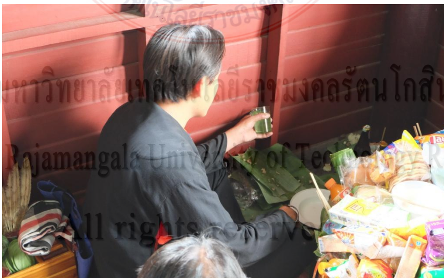
ภาพที่ 4.9 หมอเสนส่งอาหารให้ผีเรือน

พิธีครั้งที่ 6 เรียกว่า “เสนเหล่ากู่” เป็นการรินเหล่าแล้วเชิญวิญญาณบรรพบุรุษมา กินเหล่า จากนั้นจะมีคนมาช่วยยกปานเพื่อนออกจากกะล้อห้อง แล้วแบ่งเครื่องเซ่นให้หมอเสน และแจกญาติๆไปรับประทานที่บ้าน หมอเสนจะกล่าวคำขวัญ “ส่งล่าเรือน” เป็นการอวยพรให้ ขวัญอยู่ดีมีสุข เป็นอันเสร็จพิธี