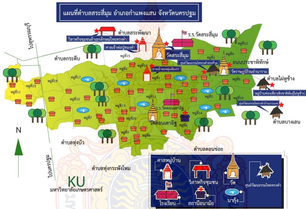
ภาพที่ 4.15 แผนที่ทรัพยากรการท่องเที่ยวในชุมชนและใกล้เคียง