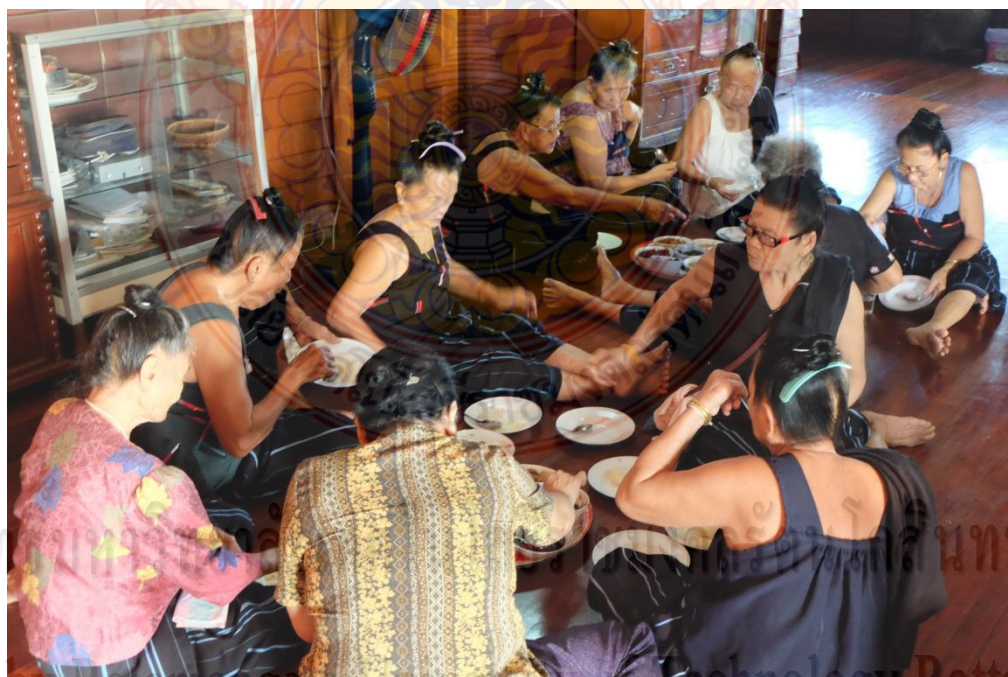
ภาพที่ 4.10 ญาติที่มาร่วมงานเสนเรือรับประทานอาหารร่วมกัน

การเซ่นครั้งที่ 2 เรียกว่า “มอปปานงาย” เจ้าของบ้านจะเตรียมเครื่องเซ่น มีเหล้าไก่ต้มสุก ไส้ลงในปานผื่อน แล้วหมอเสนจะทำพิธีและกล่าวอวยพร จากนั้นพวกญาติที่มาร่วมงานร่วมกันรับประทานอาหารเป็นอันเสร็จพิธี