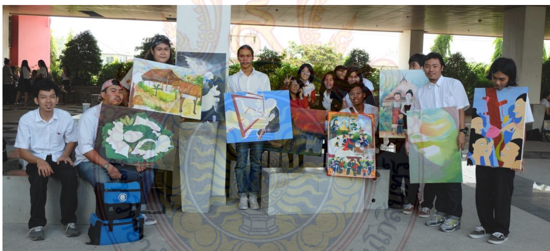
ภาพที่ 6.1 การตรวจความก้าวหน้าผลงานของนักศึกษา

1. การบูรณาการกับการเรียนการสอนในรายวิชา ทักษะศิลป์ โดยให้นักศึกษาจัดทำภาพเขียนที่ถ่ายทอดวัฒนธรรมไททรงดำในมิติต่างๆ ในหัวข้อ “ถอดชีวิตจากภาพ ทราบเรื่องราวไททรงดำ กำแพงแสน”