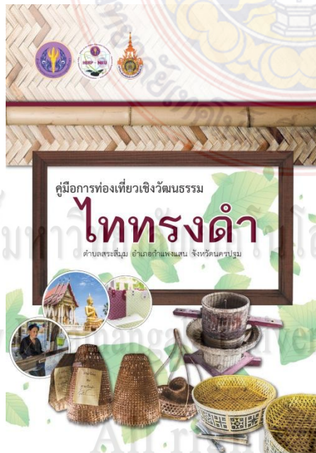
(ค) หน้าปกใน