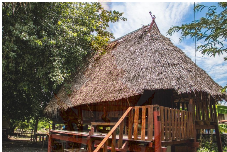
ภาพที่ 4.14 บ้านไผ่หูช้าง ตำบลไผ่หูช้าง อำเภอบางเลน