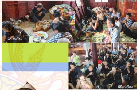
ภาพประกอบ: (ซ้าย) พิธีเล่นเวียน (ขวา) พิธีเล่นเวียน

พิธีเล่นเวียนคือการเล่นเพลงภาษาพื้นบ้านที่เล่นกันมาตั้งแต่สมัยโบราณ มีทั้งที่เล่นเดี่ยว 1 ครั้ง ในเดือน 4 เดือน 6 หรือเดือน 12 (เดือนจันและเดือน 10) มีการทำพิธีเพราะคนไข้มีความเชื่อว่าผีเรือนกลับไม่ผ่านหรือผีฟ้า จะไม่มาทรมานใครๆ ในการเล่น (หรือ) คนไข้ทำพิธีว่าทำพิธีเล่นไว้เป็นการระงับหรือระงับบรรพบุรุษที่ล่วงลับไปแล้ว แสดงออกถึงความศรัทธาและเคารพบรรพบุรุษให้ช่วยปกป้องคุ้มครองลูกหลานไม่มีความทุกข์ความเจ็บป่วย การทำพิธีเล่นเวียนมีอยู่สองแบบคือแบบที่เล่นเดี่ยว และแบบที่เล่นเป็นวง ซึ่งแบบที่เล่นเดี่ยวเล่นได้แก่ พิธีบวช พิธีบวชข้าวใหม่ พิธีเล่นอวยพรขึ้นเรือน พิธีเล่นกลางบ้าน เป็นต้น