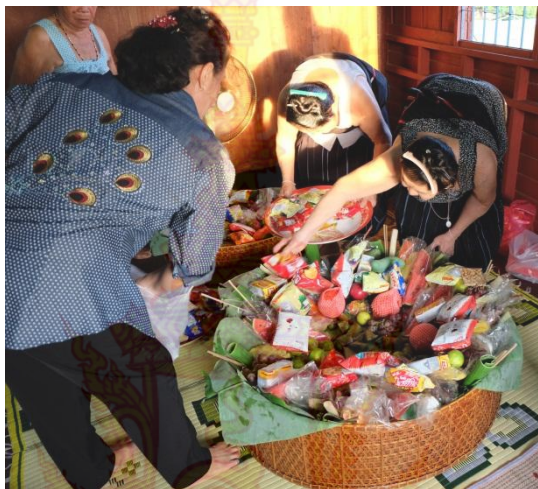
ภาพที่ 4.7 เครื่องเซ่นไหว้ผีเรือน

อาหารที่ใช้ในพิธีและเลี้ยงแขกที่ขาดไม่ได้เด็ดขาดคือ แกงหน่อไม้เปรี้ยว ต้มกระดูกหมู ผักกาดดอง ต้มเครื่องใน