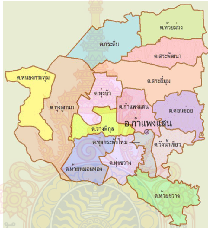
ภาพที่ 2.2 แสดงที่ตั้งและอาณาเขตจังหวัดนครปฐม