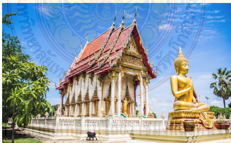
ภาพที่ 4.13 วัดลาดปลาเค้า

2. วัดลาดปลาเค้า ภายในวัดประดิษฐานพระเกจิอาจารย์ คือ หลวงพ่อดำ ที่ชาวไททรงดำให้ความนับถืออย่างมาก และเชื่อว่ามีคุณศักดิ์สิทธิ์ ดลบันดาลตามสิ่งที่ขอ