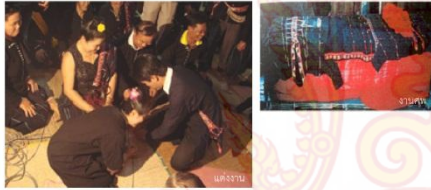
ภาพประกอบ: (ซ้าย) การเต้นรำในงานฉลองปีใหม่ (ขวา) พิธีสงฆ์ในวันขึ้นปีใหม่

6.ขึ้นปีใหม่ ตามธรรมเนียมของชาวไทยแต่ละถิ่น วันขึ้นปีใหม่นั้นจะเริ่มต้นในวันขึ้น 1 ค่ำ ของเดือน 6 ซึ่งถือว่าเป็นวันแรกของการทำงานของคนในคำร์หลังจากที่หยุดพักผ่อนตลอดเดือน 5 ค่ำแล้วในวันขึ้นปีใหม่จะมีการเริ่มพิธีเล่นคำขวัญ มีการปฏิบัติคำขวัญ ละพิธีสงฆ์ที่มี สวมใส่ชุดใหม่ในวันขึ้นปีใหม่เชื่อกันว่าคำขวัญกับคนใจดีจะไปวัดทำบุญ