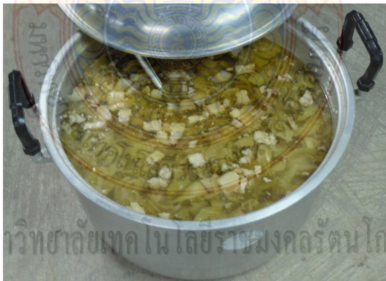
ภาพที่ 4.8 ต้มกระดูกหมูผักกาดดอง

อาหารที่ใช้ในพิธีและเลี้ยงแขกที่ขาดไม่ได้เด็ดขาดคือ แกงหน่อไม้เปรี้ยว ต้มกระดูกหมู ผักกาดดอง ต้มเครื่องใน