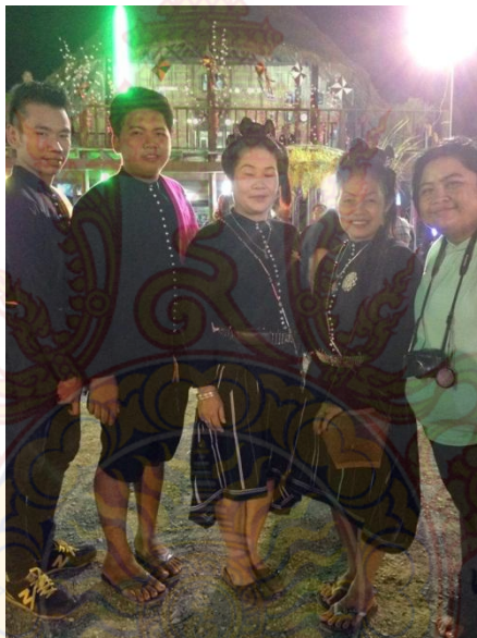
ภาพที่ 4.11 การแต่งกายของชาวไททรงดำ

และชุดที่สวมใส่ในพิธีกรรมต่างๆ สมัยก่อนผู้ชายผู้หญิงเขาใส่เสื้อทอด้วยผ้าฝ้ายย้อมสีดำ เรียกว่า “เสื้อก้อม” ส่วนนางเกงผู้ชายก็ใส่กางเกงด้วยผ้าฝ้ายย้อมสีดำ เรียกว่า “ส้วงก้อม” ส่วนผู้หญิงเขาก็ใส่ผ้าซิ่น ปัจจุบันเสื้อผ้าของชาวไททรงดำส่วนใหญ่ จะใส่กันในพิธีกรรม หรือช่วงเทศกาลสำคัญของชาวไททรงดำ