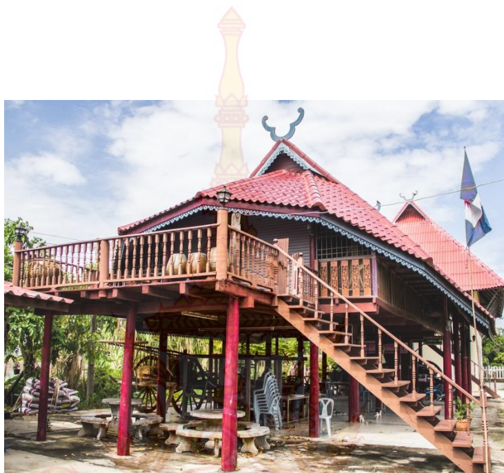
ภาพที่ 4.12 ศูนย์วัฒนธรรมไททรงดำบ้านสระสี่มุม

2. วัดลาดปลาเค้า ภายในวัดประดิษฐานพระเกจิอาจารย์ คือ หลวงพ่อดำ ที่ชาวไททรงดำให้ความนับถืออย่างมาก และเชื่อว่ามีคุณศักดิ์สิทธิ์ ดลบันดาลตามสิ่งที่ขอ