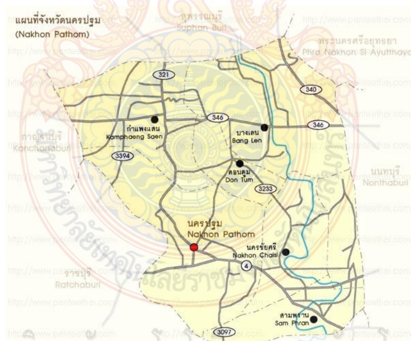
ภาพที่ 2.1 แสดงที่ตั้งและอาณาเขตจังหวัดนครปฐม