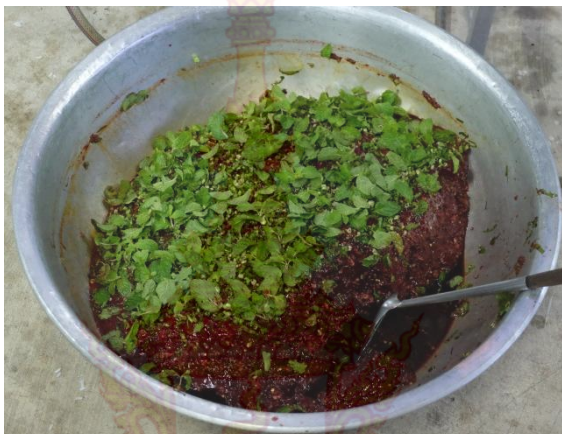
ภาพที่ 4.3 อาหารพื้นบ้าน