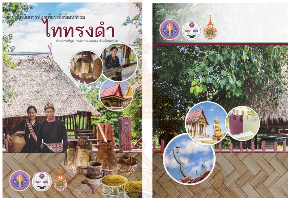
ภาพที่ 4.16 คู่มือการท่องเที่ยวเชิงวัฒนธรรมไททรงดำบ้านสระสีมุ่ม