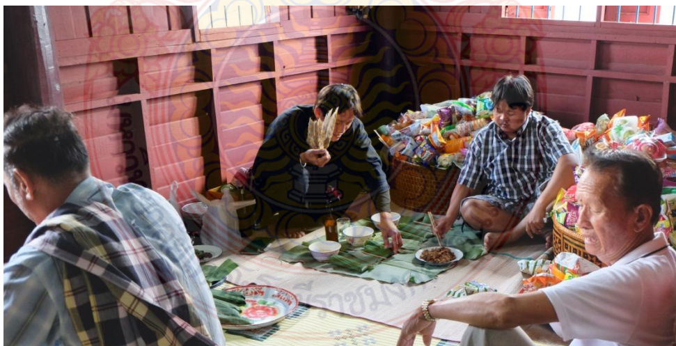
ภาพที่ 4.6 หมอสอนทำพิธีไหว้ผีเรือนภายในกะล้อห้อง

ประเพณีการเสนเรือนจะมี 2 กลุ่ม คือ การเสนเรือนผู้น้อยเป็นตระกูลของคนสามัญธรรมดา และการเสนเรือนผู้ท้าวเป็นตระกูลที่สืบเชื้อสายมาจากเจ้าในอดีต พิธีเสนเรือนผู้น้อยโดยเจ้าภาพจะไปปรึกษาหมอสอนกำหนดวันโดยเลือกวันที่ไม่ตรงกับวันตายของพ่อหรือเฒ่าศพ จากนั้นไปบอกญาติพี่น้องที่มีผีเดียวกัน และแขกมาร่วมงาน ญาติพี่น้องที่มีสายเลือดเดียวกัน พ่อแม่เดียวกันจะแต่งกายด้วยชุดธรรมดา ส่วนญาติที่มาจากกาการแต่งงานจะใส่ชุดเสื้อฮี ส่วนแขกที่มาร่วมงานจะใส่ชุดธรรมดา