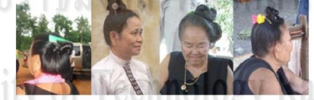
ภาพประกอบ: ทรงผม