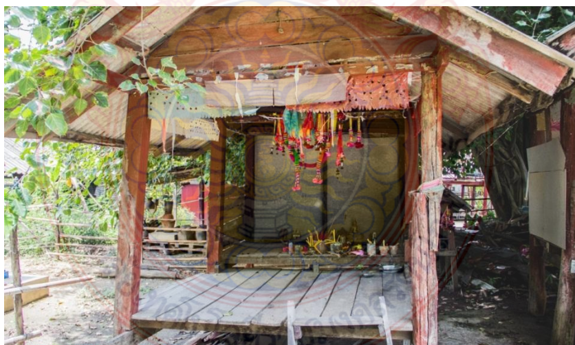
ภาพที่ 4.5 เจ้าพ่อ

2. ผีประจำหมู่บ้าน ผีประจำหมู่บ้าน คือ เจ้าพ่อ ถือเป็น “สิ่งศักดิ์สิทธิ์ประจำหมู่บ้าน” ที่ชาวบ้านแต่ละหมู่บ้านให้ความเคารพนับถือ สร้างศาลให้อยู่ และมีชื่อเรียกตามชื่อหมู่บ้านเป็นส่วนใหญ่ ชาวไททรงดำเชื่อว่าผีประจำหมู่บ้านหรือเจ้าพ่อสามารถฟังฟัง เพื่อให้ช่วยคุ้มครองและปกป้องชาวบ้านและรักษาพืชผลและสัตว์เลี้ยงของชาวบ้าน และขจัดทุกข์บำรุงสุขให้แก่พวกเขาได้ ศาลเจ้าประจำหมู่บ้านนิยมสร้างให้ตั้งอยู่ใกล้ๆ ทางเพื่อให้ชาวบ้านและคนที่ผ่านไปมาพบเห็นได้ง่ายจะได้กราบไหว้ ขอพร และบนบานเจ้าพ่อได้สะดวก จะมีพิธีเลี้ยงศาลประจำหมู่บ้านร่วมกันหนึ่งครั้งในแต่ละปี คือช่วงเดือนแปดเดือนเก้า คนในหมู่บ้านก็จะมีการไปรวมกันทำพิธีเช่นไหว้ การเช่นไหว้จะมีตัวแทนผู้นำ เขาเรียกว่า “เจ้าจ้ำ” เจ้าจ้ำก็จะเป็นคนนำทำพิธีเช่นไหว้เจ้าพ่อ แล้วเขาก็จะบอกกล่าวเจ้าพ่อขอให้เจ้าพ่อคุ้มครองปกป้องรักษาให้อยู่เย็นเป็นสุข