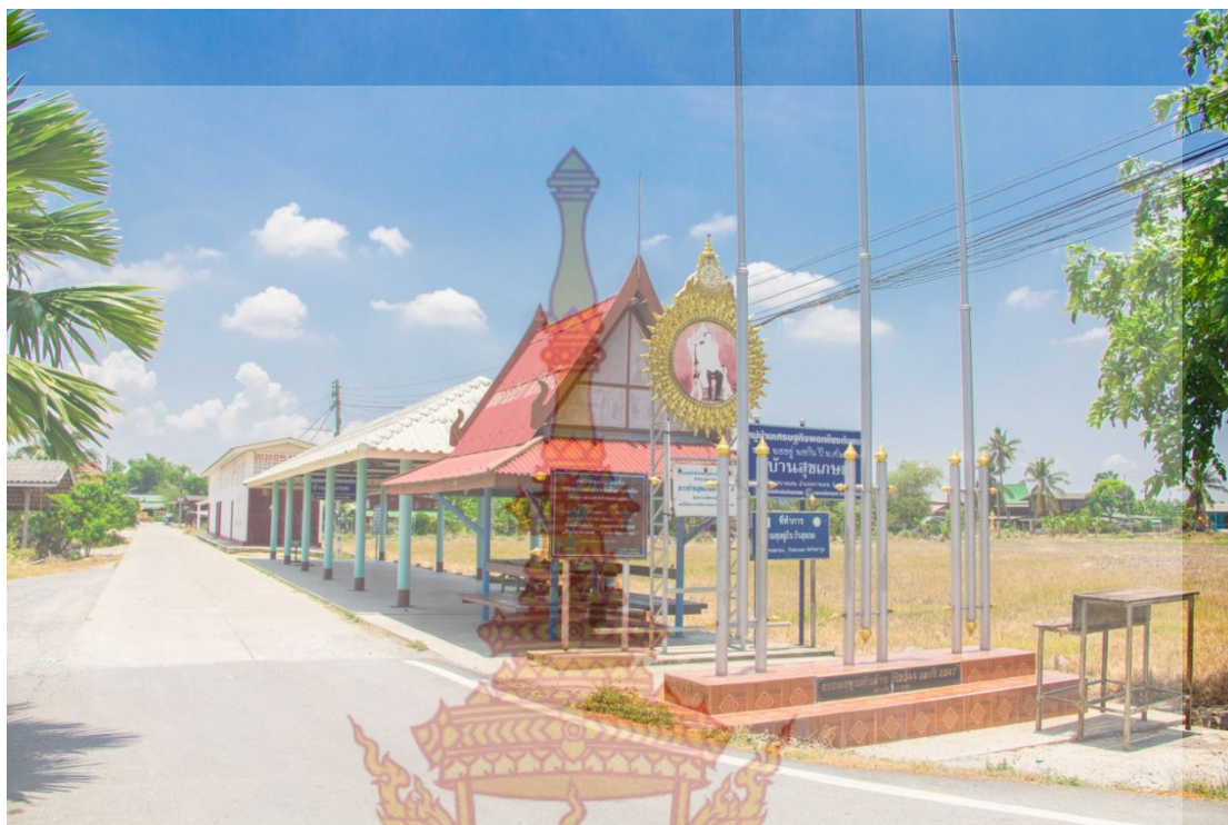
ภาพที่ 4.2 สภาพโดยทั่วไปของชุมชน