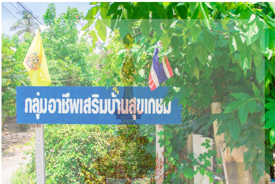
ภาพที่ 4.4 กลุ่มวิสาหกิจชุมชนอาชีพเสริมบ้านสุขเกษม