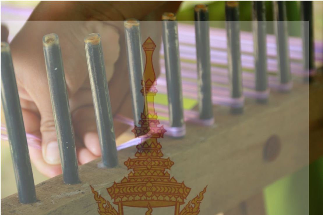
การจัดเส้นด้ายยืน (การสาวด้าย) การกำหนดชนิดผ้า การออกแบบจัดลายสลับสีเส้นด้าย กำหนดความกว้าง ความยาว ของผ้าที่จะขึ้นกี่ทอในแต่ละครั้ง