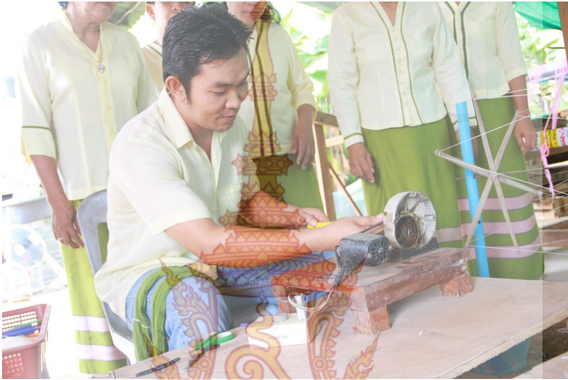
การกรอด้วยยืน การนำด้ายออกจากใจ เข้าหลอด

การสาธิตการทอผ้าพื้นบ้าน ของกลุ่มอาชีพเสริมบ้านสุขเกษม อำเภอบางเลน จังหวัดนครปฐม