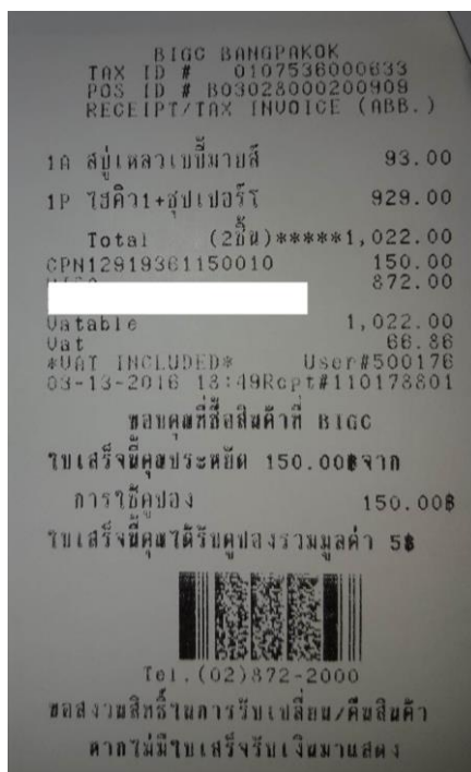
ภาพที่ 4 ตัวอย่างเอกสารประกอบการบันทึกการจ่ายค่าอุปโภคบริโภค

จากภาพที่ 2 ถึง 4 ผู้ที่บันทึกบัญชีครัวเรือนจะนำเอกสารตามตัวอย่างไว้ประกอบการบันทึกบัญชีรายจ่ายตามรายการที่จ่ายไป ช่วยป้องกันการหลงลืมหรือผิดพลาดในการบันทึก อีกทั้งยังเก็บไว้เป็นหลักฐานประกอบการบันทึกบัญชี อาจมีการแยกหมวดหมู่ในการเก็บเอกสารเหล่านี้ และจัดทำสรุปรายจ่ายแต่ละประเภทในภายหลัง เพื่อประโยชน์ในการวางแผนการใช้จ่ายเงินในอนาคตได้