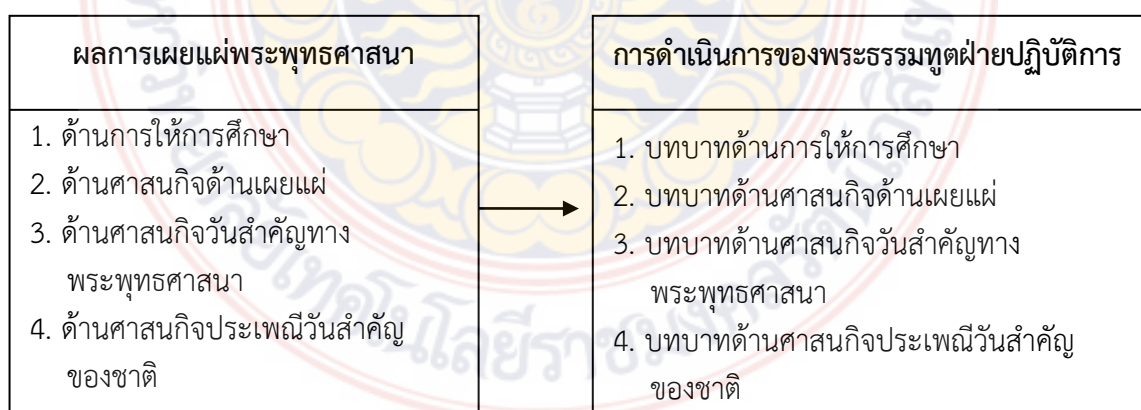
ภาพที่ 1.1 กรอบแนวคิดการวิจัย