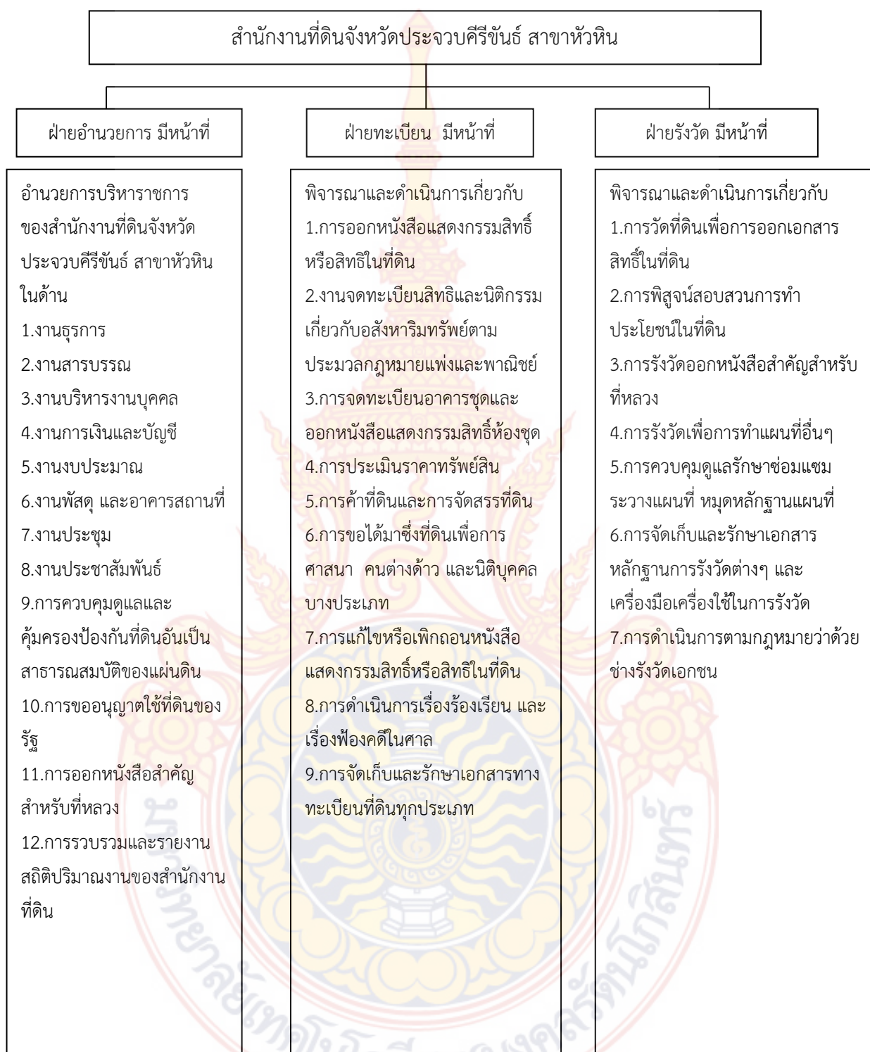
ภาพที่ 2.1 แสดงโครงสร้างภารกิจหน้าที่ของ สำนักงานที่ดินจังหวัดประจวบคีรีขันธ์ สาขาหัวหิน