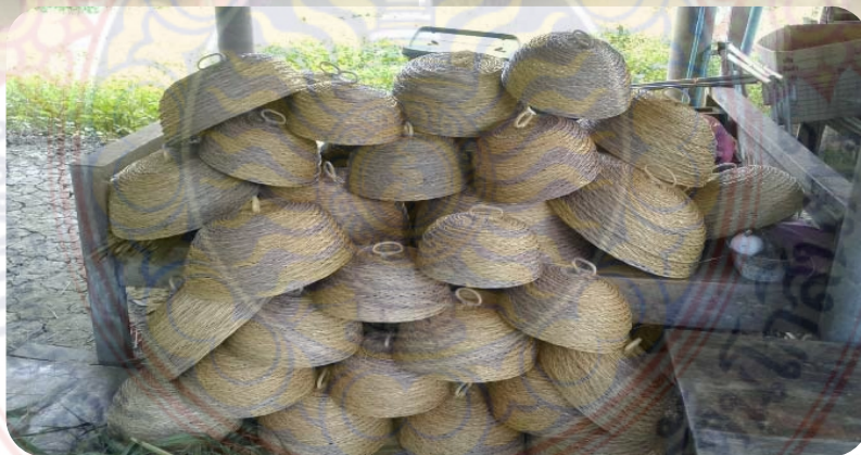
ข.2 ภาพการสานอิดและผลิตภัณฑ์ทางวัฒนธรรม