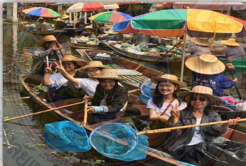
ข.5 ภาพกิจกรรมจิตอาสา นักท่องเที่ยว