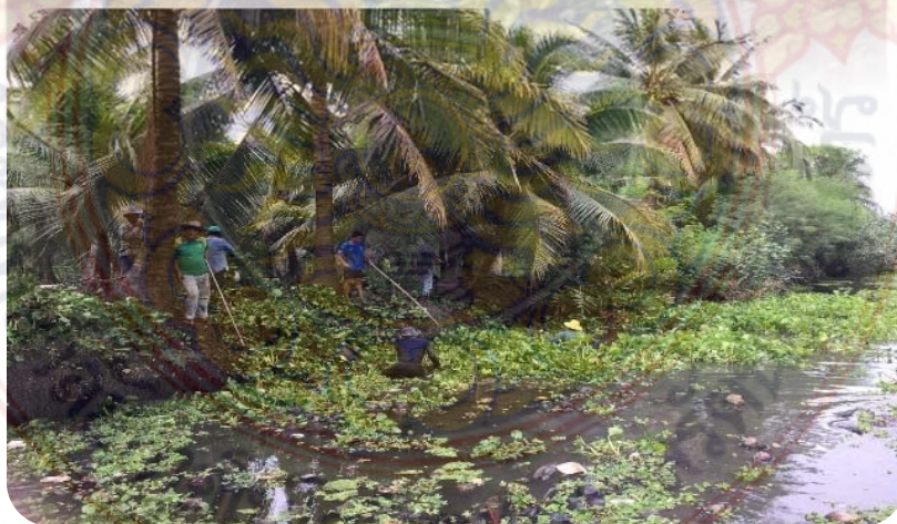
ข.1 ภาพกิจกรรมจิตอาสาคนชุมชน “ลงแขก ลงคลอง”