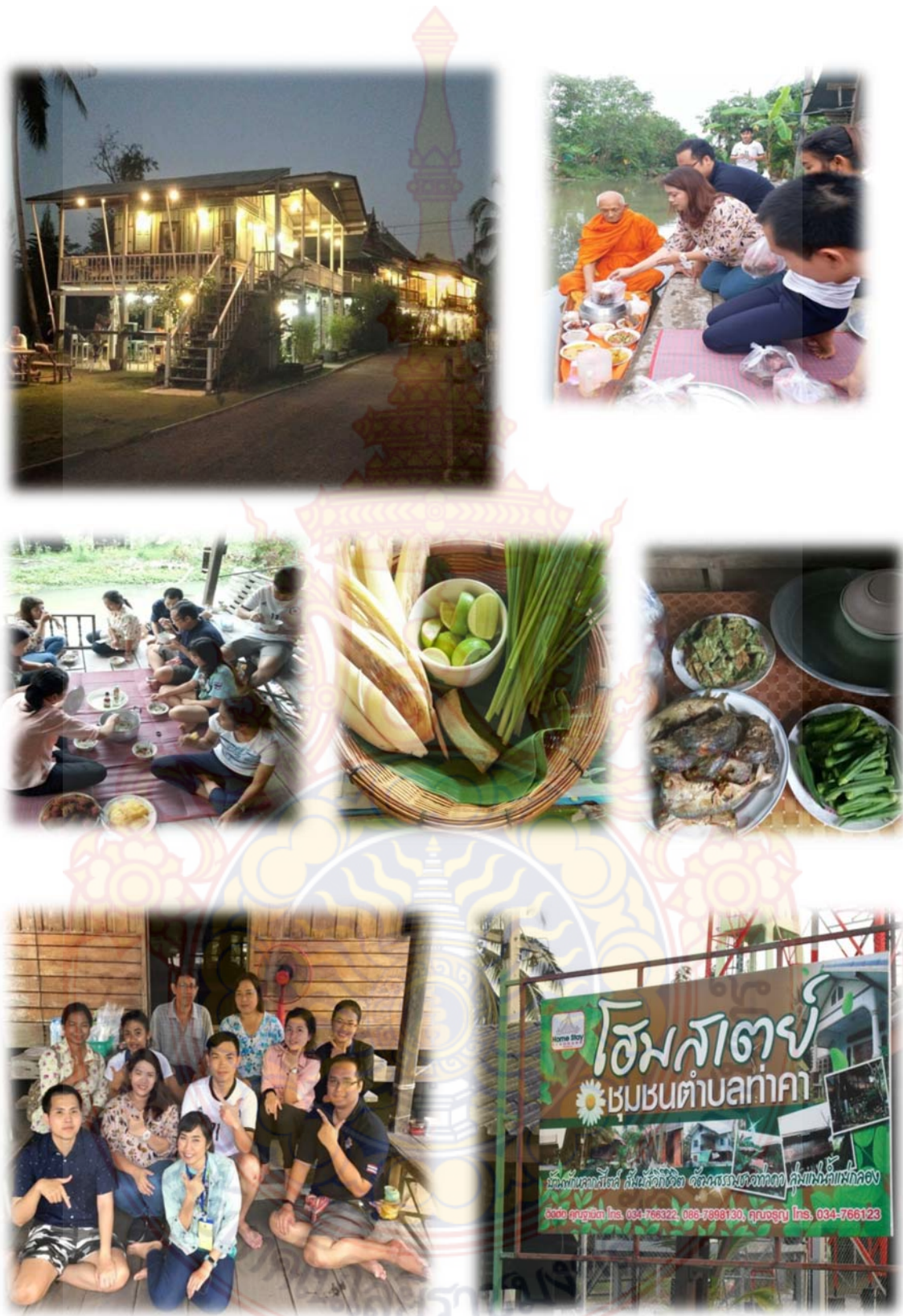
ข.6 ภาพที่พัก โฮมสเตย์ในพื้นที่แหล่งท่องเที่ยว