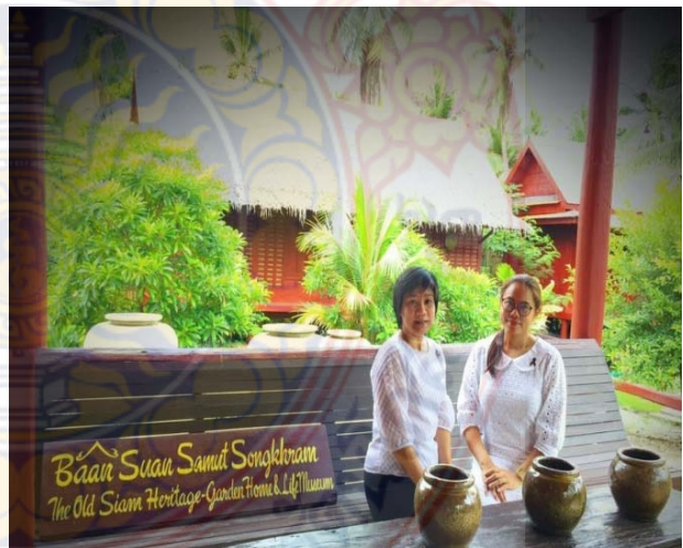
ข.9 ภาพบ้านเรือนไทย