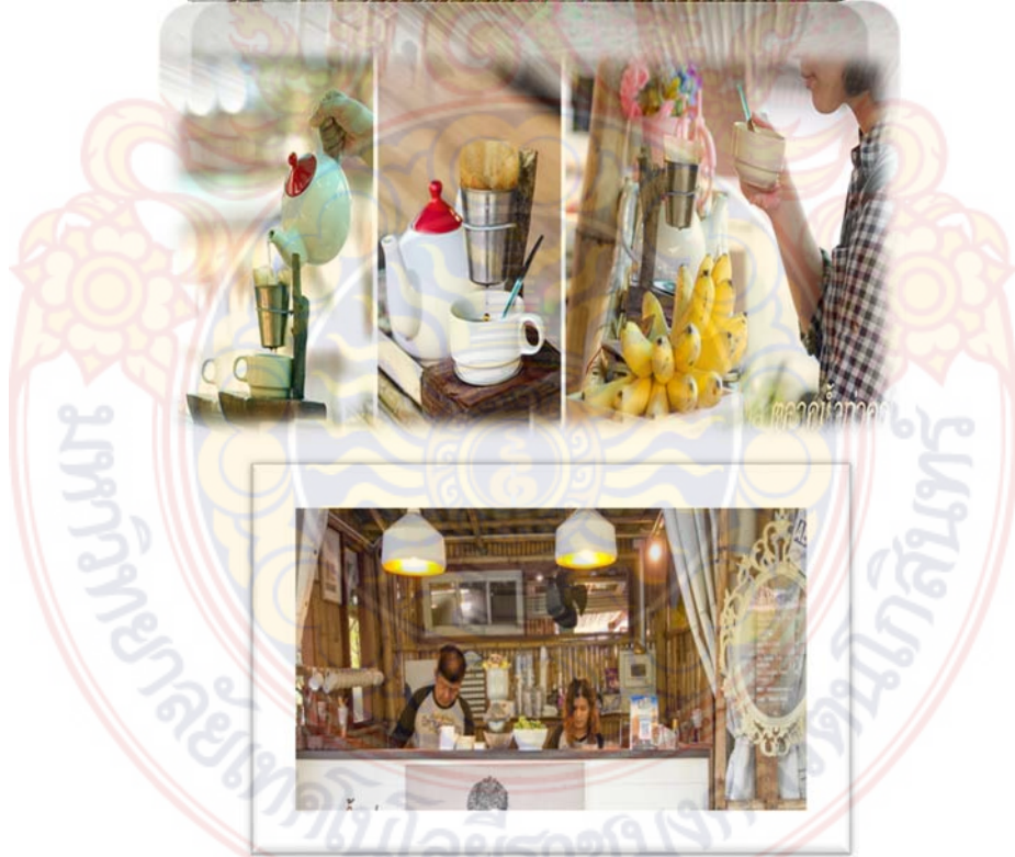
ข.3 ภาพร้านอาหาร ในพื้นที่ตลาดน้ำท่าคา