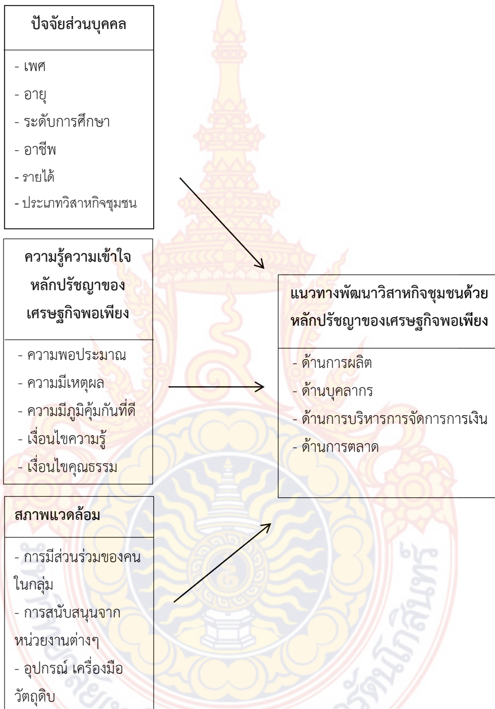
ภาพที่ 2.1 กรอบแนวความคิดแนวทางการพัฒนาวิสาหกิจชุมชนด้วยหลักปรัชญาของเศรษฐกิจพอเพียง: กรณีศึกษา ตำบลห้วยสัตว์ใหญ่ อำเภอหัวหิน จังหวัดประจวบคีรีขันธ์

การวิจัยเรื่องแนวทางการพัฒนาวิสาหกิจชุมชนด้วยหลักปรัชญาของเศรษฐกิจพอเพียง : กรณีศึกษา ตำบลห้วยสัตว์ใหญ่ อำเภอหัวหิน จังหวัดประจวบคีรีขันธ์ โดยมีกรอบแนวความคิดในดังภาพที่ 2.1