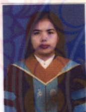
นายทะเบียนลงนามทับรูป

ให้ไว้ ณ วันที่ 26 เดือน ธันวาคม พ.ศ. 2552