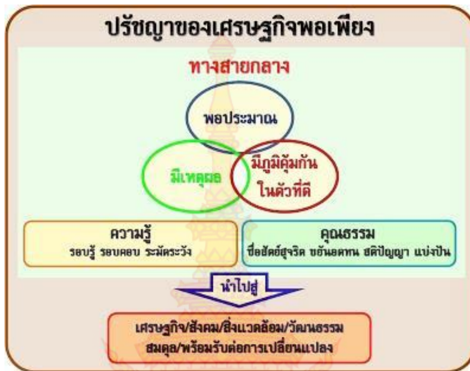
ภาพที่ 2.1 แสดงหลักปรัชญาของเศรษฐกิจพอเพียง

1) ความพอประมาณ หมายถึง ความพอดีที่ไม่น้อยเกินไปและไม่มากเกินไป โดยไม่เบียดเบียนตนเองและผู้อื่น เช่น การผลิตและการบริโภคที่อยู่ในระดับพอประมาณ