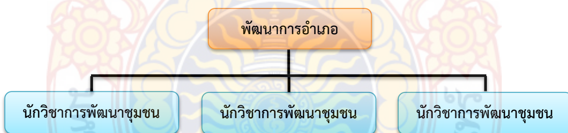
ภาพที่ 2.3 แสดงโครงสร้างของสำนักงานพัฒนาชุมชนอำเภอสามร้อยยอด

สำนักงานพัฒนาชุมชนอำเภอสามร้อยยอด เป็นหน่วยงานหนึ่งที่มีที่ตั้งสำนักงานอยู่ ณ ที่ว่าการอำเภอสามร้อยยอด เป็นหน่วยงานในส่วนภูมิภาคปฏิบัติงานในพื้นที่ระดับอำเภอ สังกัดสำนักงานพัฒนาชุมชนจังหวัดประจวบคีรีขันธ์ กรมการพัฒนาชุมชน กระทรวงมหาดไทย ดูแลพื้นที่อำเภอสามร้อยยอด จำนวน 5 ตำบล 41 หมู่บ้าน เป็นหน่วยงานของรัฐในการขับเคลื่อนกิจกรรมเพื่อส่งเสริมกระบวนการมีส่วนร่วม กระบวนการเรียนรู้ของชุมชน การบริหารจัดการชุมชน เพื่อสร้าง