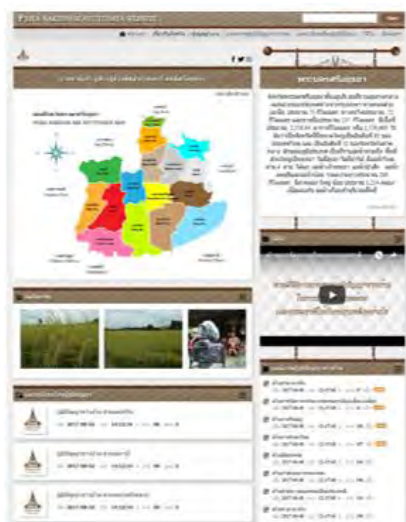
ภาพที่ 1 หน้าจอหลักของเว็บไซต์

เว็บไซต์ภูมิปัญญาชาวบ้าน จังหวัดพระนครศรีอยุธยา ผู้วิจัยได้ทำการออกแบบหน้าจอเว็บไซต์ ซึ่งประกอบด้วยหน้าจอหลักของเว็บไซต์, ข้อมูลรายชื่ออำเภอ, ข้อมูลรายละเอียดอำเภอ, ข้อมูลแผนที่อำเภอ, ข้อมูลที่ตั้งและอาณาเขตอำเภอ, ข้อมูลการติดต่อ, ข้อมูลหัวข้อองค์ความรู้ภูมิปัญญาชาวบ้าน, ข้อมูลรายละเอียดองค์ความรู้ภูมิปัญญาชาวบ้าน, หัวข้อแลกเปลี่ยนเรียนรู้ภูมิปัญญา, ข้อมูลรายละเอียดแลกเปลี่ยนเรียนรู้ภูมิปัญญา, แลกเปลี่ยนเรียนรู้ภูมิปัญญาและข้อมูลรายชื่อวิดีโอ และติดต่อเรา ซึ่งจะขอนำเสนอตัวอย่างหน้าจอ ดังรูปที่ 1 – 3