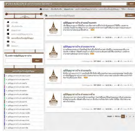
ภาพที่ 3 หน้าจอแสดงข้อมูลหัวข้อแลกเปลี่ยนเรียนรู้ภูมิปัญญา