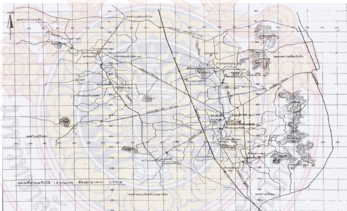
ภาพที่ 2.1 พื้นที่องค์การบริหารส่วนตำบลทับใต้ อำเภอหัวหิน จังหวัดประจวบคีรีขันธ์

7. ประชากร มีประชากร จำนวน 11,691 คน แยกเป็นชาย 5,668 คน เพศหญิง 6,023 คน จำนวนครัวเรือน 4,820 หลังคาเรือน มีความหนาแน่นเฉลี่ย 84 คน/ตารางกิโลเมตร