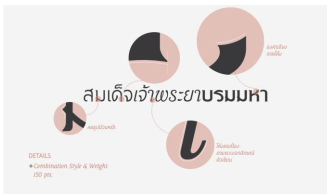
รูปที่ 3 รูปแบบอักษรที่เป็นเอกลักษณ์ตัวพิมพ์ศรีสุริยวงศ์

เอกลักษณ์ของตัวพิมพ์ศรีสุริยวงศ์ พบว่าปลายเส้นอักษรออกแบบให้มีลักษณะกึ่งมีฐาน (serif) ตามรูปแบบอักษรละตินซึ่งเป็นมิติที่อุปมาอุปไมยถึง การผสมกันระหว่างแนวคิดแบบตะวันออกและตะวันตก ตามแนวคิดของสมเด็จพระยาบรมมหาศรีสุริยวงศ์ (ช่วง บุนนาค)