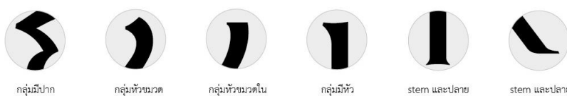
รูปที่ 2 รูปแบบองค์ประกอบอัตลักษณ์ตัวพิมพ์ศรีสุริยวงศ์

องค์ประกอบอัตลักษณ์ตัวอักษรทั้งไทยและละติน หรือเรียกว่าอีกอย่างหนึ่งว่า Visual Gramma หมายถึงชิ้นส่วนที่ใช้ประกอบกันขึ้นเป็นพยัญชนะต่างๆ เช่น ส่วนหัวอักษร เส้นตั้ง เส้นนอน ปลายหาง เป็นต้น ซึ่งผลการออกแบบขององค์ประกอบอัตลักษณ์ตัวพิมพ์ศรีสุริยวงศ์ ได้รูปแบบดังนี้