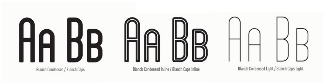
รูปที่ 1 แบบตัวพิมพ์ Blanch น้ำหนักต่างๆ ที่ออกแบบเพื่อสร้างอัตลักษณ์ผลิตภัณฑ์ Blanch