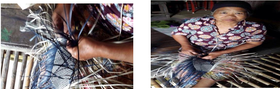
รูปที่ 4 การสานกระเป๋าด้วยเตยปาดำ

3.2.4 ขึ้นใส่หูกระเป๋าและตกแต่งรายละเอียด นิยมถักด้วยลายหนึ่งโดยใช้สายยางขนาดที่เหมาะสมกับกระเป๋าเป็นแกนกลางความยาวของหูกระเป๋าขึ้นอยู่กับความต้องการที่ลูกค้าสั่งมา