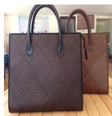
รูปแบบที่ 9