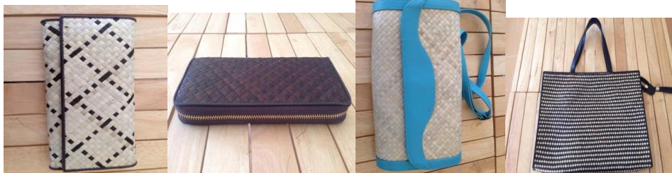
รูปแบบที่ 5