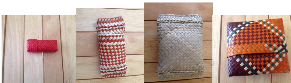
รูปแบบที่1