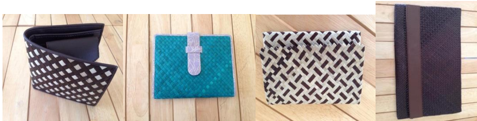
รูปแบบที่ 1