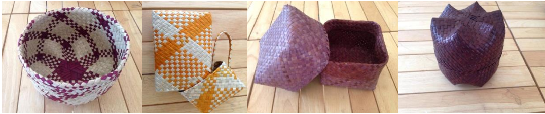
รูปแบบที่1