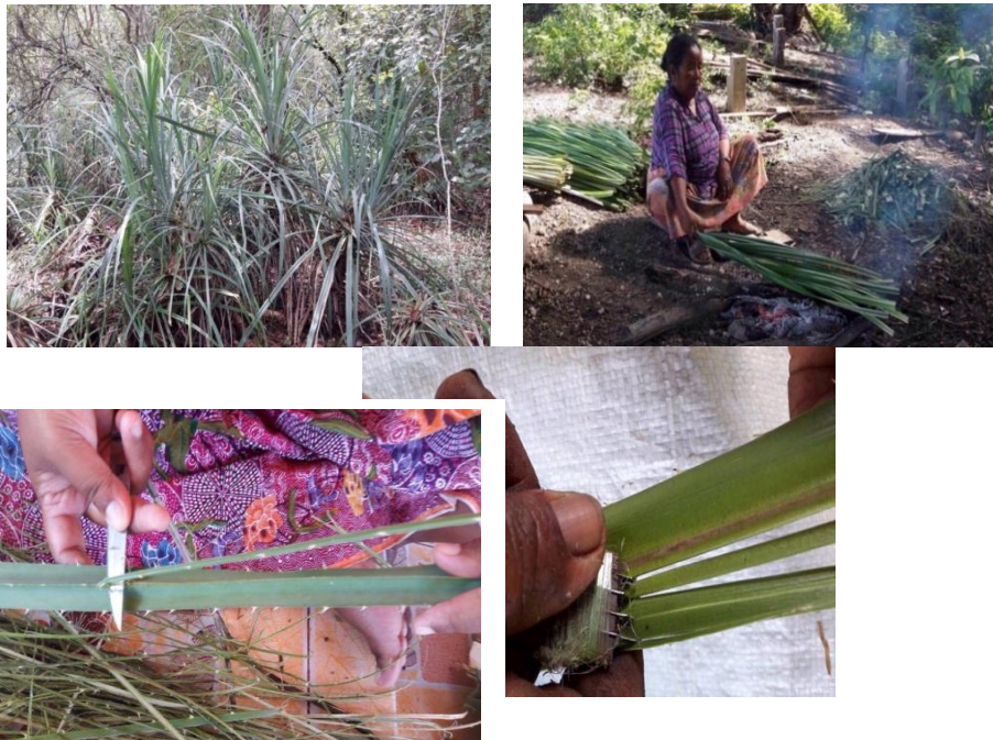
รูปที่ 3 การคัดเลือกเตยปาดำมาใช้สำหรับงานจักสาน

3.1.9 นำตอกเตยที่ย้อมเรียบร้อยแล้วไปตาก เมื่อแห้งก็จะได้ตอกเตยที่มีขนาดสีต่างๆจากย้อมแล้วนำมาสานกันเป็นรูปลักษณะต่างๆ ตามที่ต้องการ