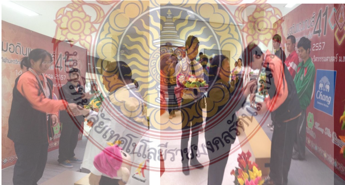
ภาพที่ 3 นักกีฬามากrukไทยได้รับเหรียญเงิน