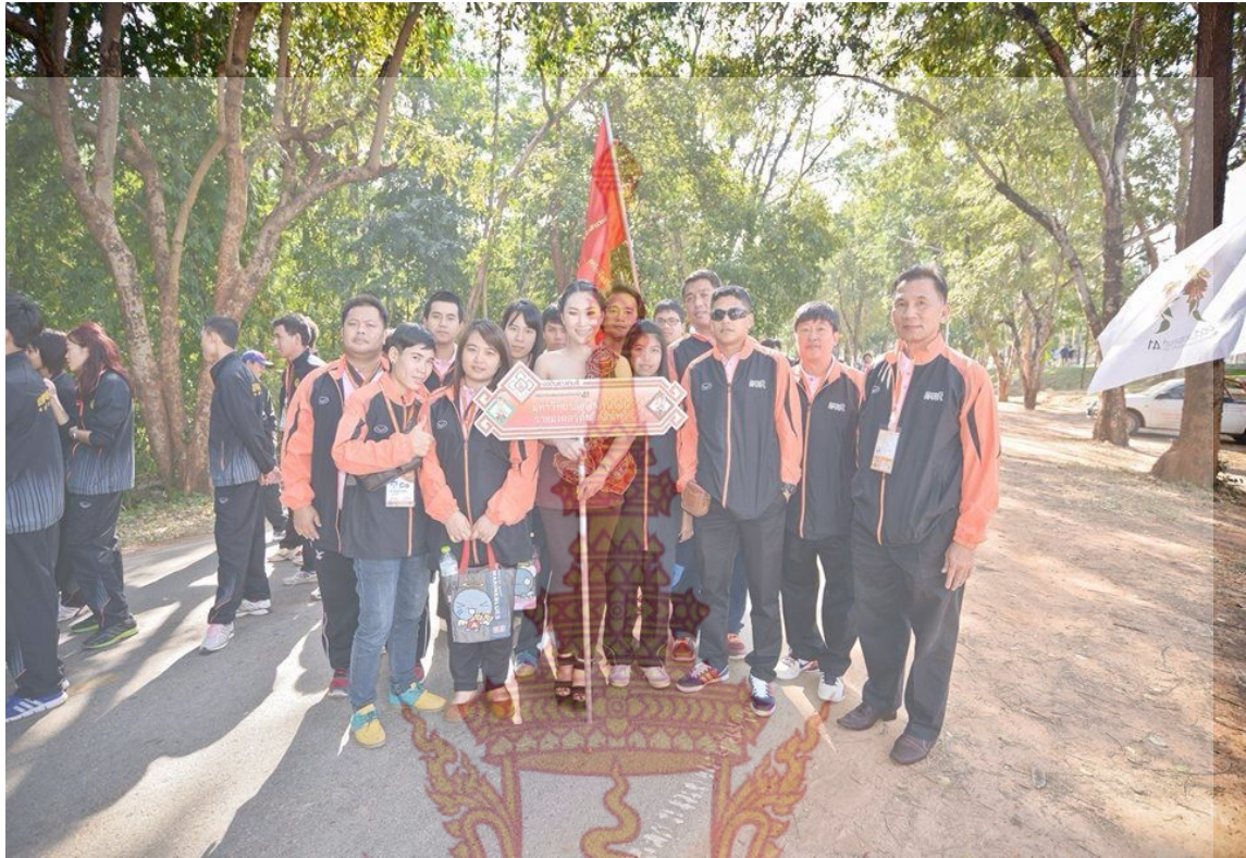
ภาพที่ 2 นักกีฬาและผู้ฝึกสอนเข้าร่วมพิธีเปิดการแข่งขัน