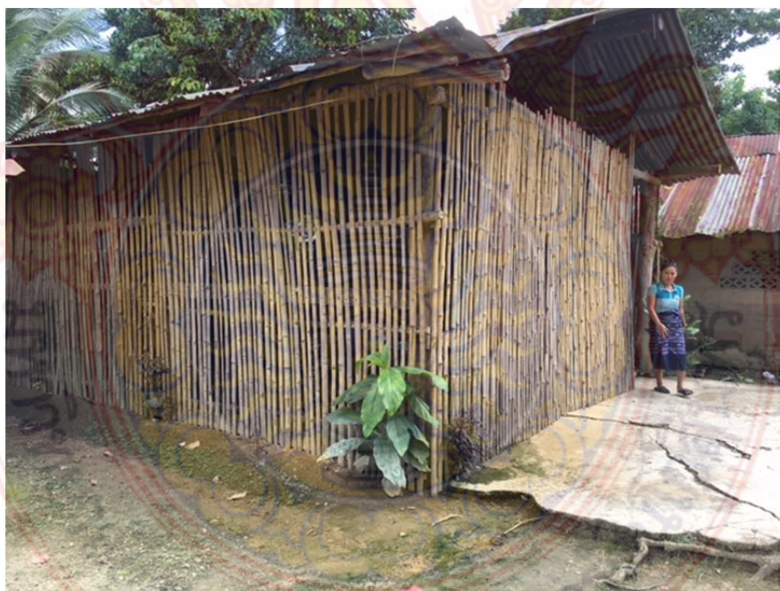
ภาพที่ ก.4 ศูนย์การเรียนรู้ชุมชนไทยภูเขา “แม่ฟ้าหลวงบ้านโคนมพัฒนา” หมู่บ้านชนเผ่าปากากะยอ ตำบลห้วยสัตว์ใหญ่ อำเภอหัวหิน จังหวัดประจวบคีรีขันธ์ 1 ตุลาคม พ.ศ. 2560