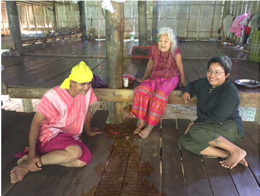
ภาพที่ ก.9 ผู้นำชุมชน และประชาชนผู้ถ่ายทอดการทอผ้ากี่เอว หมู่บ้านชนเผ่าปากกะยอ ตำบลห้วยสัตว์ใหญ่ อำเภอหัวหิน จังหวัดประจวบคีรีขันธ์ ที่มา : ผู้วิจัย 8 ตุลาคม พ.ศ. 2560