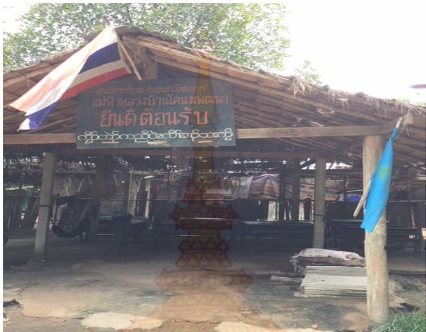
ภาพที่ ก.3 ศูนย์การเรียนรู้ชุมชนไทยภูเขา “แม่ฟ้าหลวงบ้านโคนมพัฒนา” หมู่บ้านชนเผ่าปากากะยอ ตำบลห้วยสัตว์ใหญ่ อำเภอหัวหิน จังหวัดประจวบคีรีขันธ์ 1 ตุลาคม พ.ศ. 2560