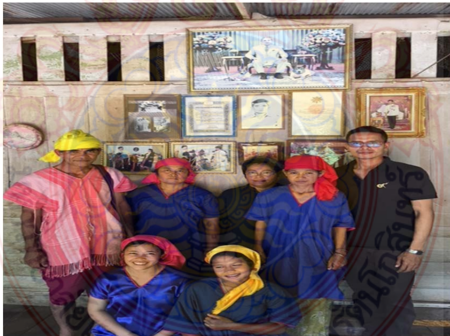
ภาพที่ ก.8 ผู้นำชุมชน และชาวบ้านผู้สืบทอดการทอผ้ากี่เอว หมู่บ้านชนเผ่าปากากะยอ ตำบลห้วยส์ตวิใหญ่ อำเภอหัวหิน จังหวัดประจวบคีรีขันธ์ ที่มา : ผู้วิจัย 8 ตุลาคม พ.ศ. 2560