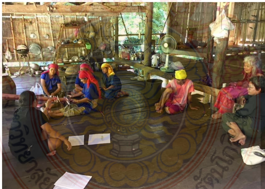
ภาพที่ ก.16 สัมภาษณ์ผู้นำชุมชน ปราชญ์ และผู้สืบทอดการทอผ้าเกี๊ยะ

หมู่บ้านชนเผ่าปากากะยอ ตำบลห้วยสัตว์ใหญ่ อำเภอหัวหิน จังหวัดประจวบคีรีขันธ์ ที่มา : ผู้วิจัย 8 ตุลาคม พ.ศ. 2560