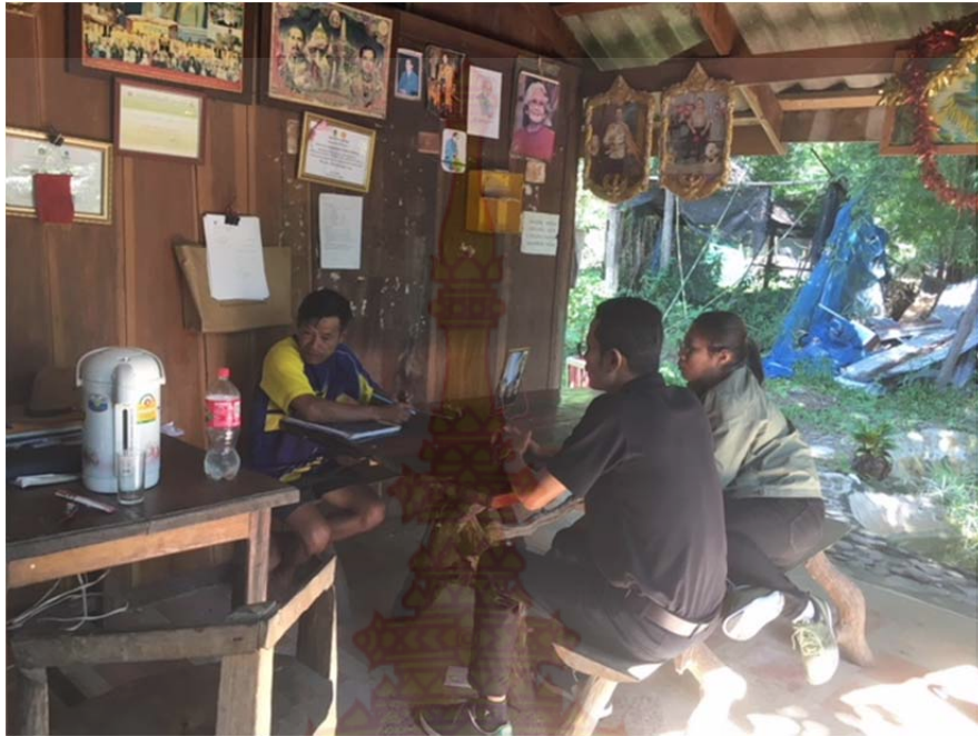
ภาพที่ ก.19 สัมภาษณ์ผู้ใหญ่บ้านป่าละอู หมู่บ้านชนเผ่าปากากะยอ ตำบลห้วยสัตว์ใหญ่ อำเภอหัวหิน จังหวัดประจวบคีรีขันธ์ 22 ตุลาคม พ.ศ. 2560