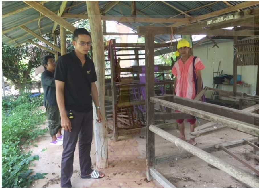
ภาพที่ ก.5 โรงทอผ้ากี่เอว แห่งที่ 1 หมู่บ้านชนเผ่าปากากะยอ ตำบลห้วยสัตว์ใหญ่ อำเภอหัวหิน จังหวัดประจวบคีรีขันธ์ ที่มา : ผู้วิจัย 8 ตุลาคม พ.ศ. 2560