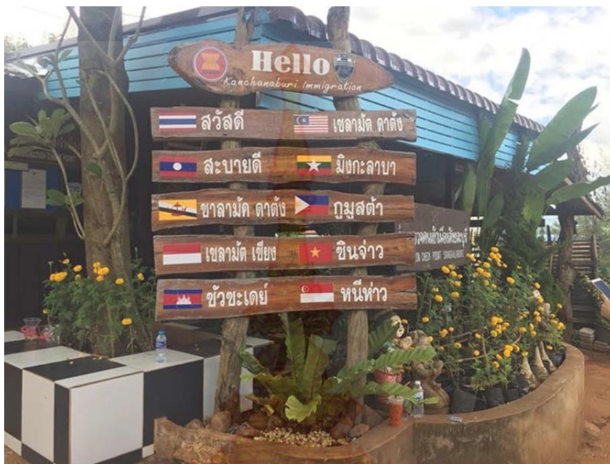
ภาพที่ ก.1 คำทักทายของประเทศเพื่อนบ้าน

หมู่บ้านชนเผ่าปากากะยอ ตำบลห้วยสัตว์ใหญ่อำเภอหัวหิน จังหวัดประจวบคีรีขันธ์ 1 ตุลาคม พ.ศ. 2560