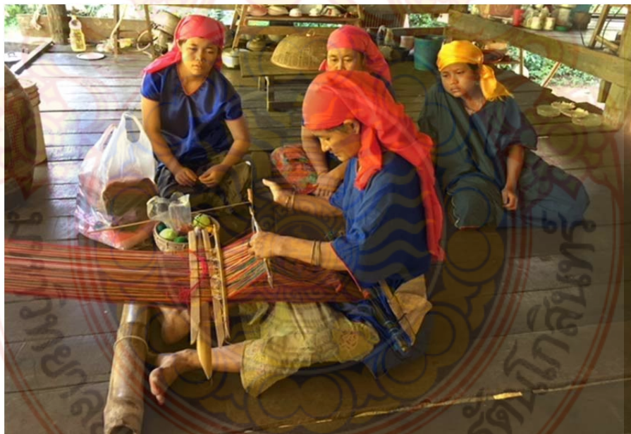
ภาพที่ ก.12 กระบวนการ ขั้นตอน การทอผ้ากี่เอว ขั้นตอนที่ 3 หมู่บ้านชนเผ่าปากากะยอ ตำบลห้วยสัตว์ใหญ่ อำเภอหัวหิน จังหวัดประจวบคีรีขันธ์ 8 ตุลาคม พ.ศ. 2560