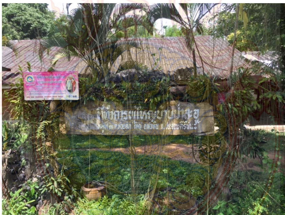
ภาพที่ ก.18 ทำการผู้ใหญ่บ้านป่าละอู หมู่บ้านชนเผ่าปากกาะยอ ตำบลห้วยสัตว์ใหญ่ อำเภอหัวหิน จังหวัดประจวบคีรีขันธ์ ที่มา : ผู้วิจัย 22 ตุลาคม พ.ศ. 2560