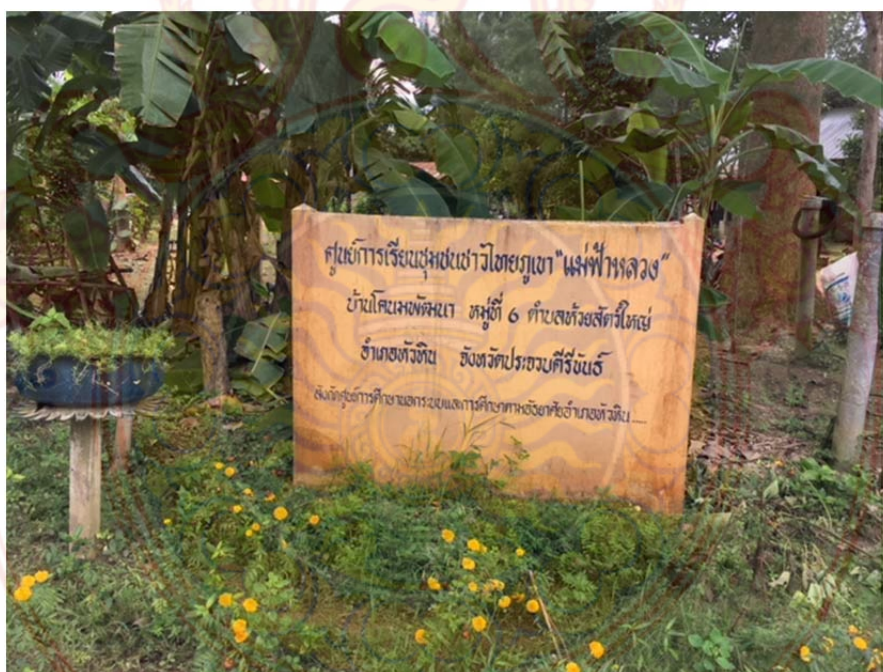
ภาพที่ ก.2 ศูนย์การเรียนรู้ชุมชนชาวไทยภูเขา “แม่ฟ้าหลวง”

หมู่บ้านชนเผ่าปากากะยอ ตำบลห้วยสัตว์ใหญ่อำเภอหัวหิน จังหวัดประจวบคีรีขันธ์ ที่มา : ผู้วิจัย 1 ตุลาคม พ.ศ. 2560