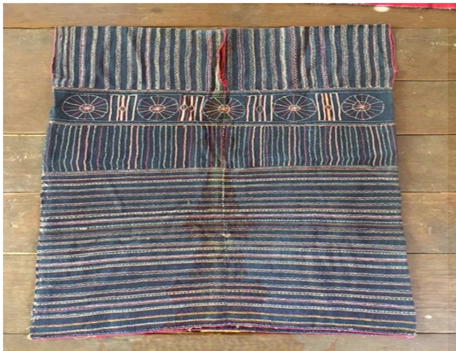
ภาพที่ ก.15 ตัวอย่างเสื้อผ้าทอเกี๊ยะ

หมู่บ้านชนเผ่าปากากะยอ ตำบลห้วยสัตว์ใหญ่ อำเภอหัวหิน จังหวัดประจวบคีรีขันธ์ 8 ตุลาคม พ.ศ. 2560