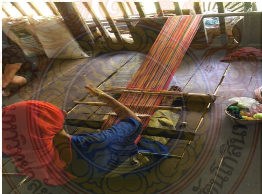
ภาพที่ ก.10 กระบวนการ ขั้นตอน การทอผ้ากี่เอว ขั้นตอนที่ 1 หมู่บ้านชนเผ่าปากกะยอ ตำบลห้วยสัตว์ใหญ่ อำเภอหัวหิน จังหวัดประจวบคีรีขันธ์ ที่มา : ผู้วิจัย 8 ตุลาคม พ.ศ. 2560