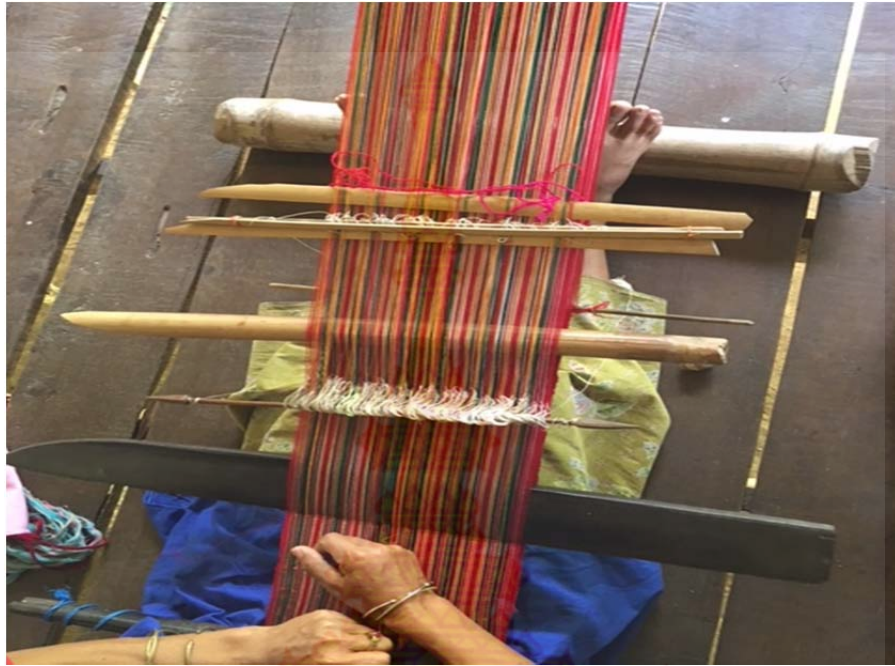
ภาพที่ ก.13 กระบวนการ ขั้นตอน การทอผ้ากี่เอว ขั้นตอนที่ 4 หมู่บ้านชนเผ่าปากากะยอ ตำบลห้วยสัตว์ใหญ่ อำเภอหัวหิน จังหวัดประจวบคีรีขันธ์ ที่มา : ผู้วิจัย 8 ตุลาคม พ.ศ. 2560