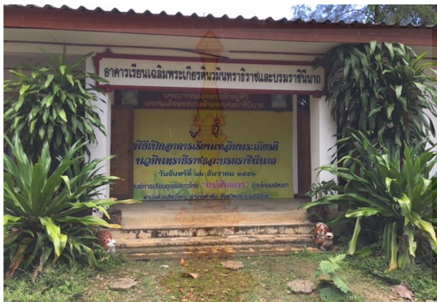
ภาพที่ ก.17 อาคารเรียนเฉลิมพระเกียรติสมเด็จพระเจ้าบรมวงศ์เธอ เจ้าฟ้าจุฬาภรณวลัยลักษณ์ อัครราชกุมารี หมู่บ้านชนเผ่าปากกาะยอ ตำบลห้วยสัตว์ใหญ่ อำเภอหัวหิน จังหวัดประจวบคีรีขันธ์ 22 ตุลาคม พ.ศ. 2560