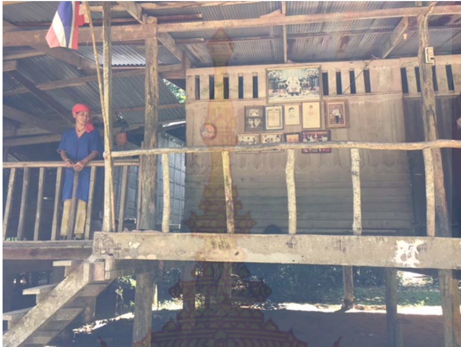
ภาพที่ ก.7 หมู่บ้านชนเผ่าปาเกอญอ ที่ในหลวง ร.9 เคยเสด็จมา หมู่บ้านชนเผ่าปากากะยอ ตำบลห้วยส์ตวิใหญ่ อำเภอหัวหิน จังหวัดประจวบคีรีขันธ์ 8 ตุลาคม พ.ศ. 2560