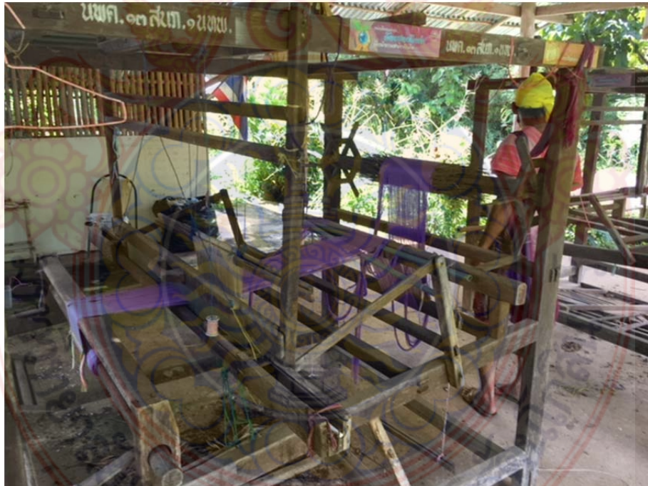
ภาพที่ ก.6 โรงทอผ้ากี่เอว แห่งที่ 2 หมู่บ้านชนเผ่าปากากะยอ ตำบลห้วยสัตว์ใหญ่ อำเภอหัวหิน จังหวัดประจวบคีรีขันธ์ 8 ตุลาคม พ.ศ. 2560