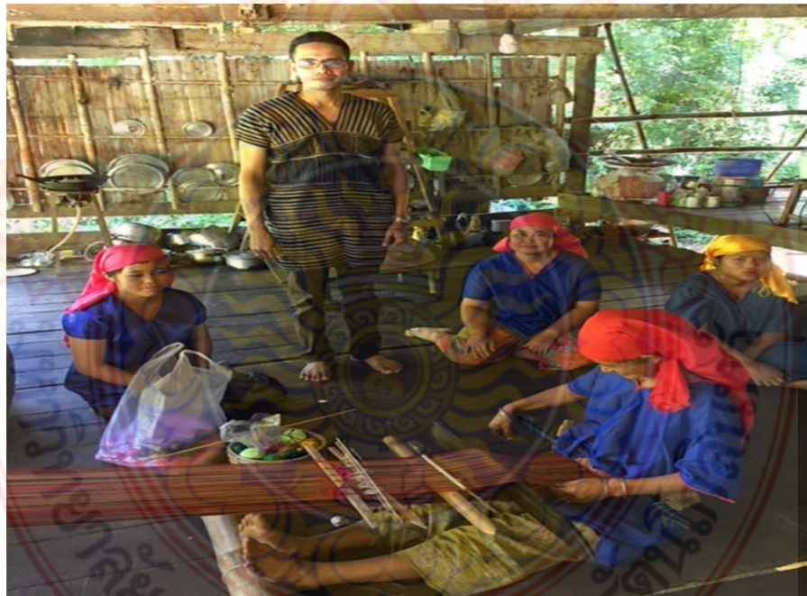
ภาพที่ ก.14 กระบวนการ ขั้นตอน การทอผ้ากี่เอว ขั้นตอนที่ 5 หมู่บ้านชนเผ่าปากากะยอ ตำบลห้วยสัตว์ใหญ่ อำเภอหัวหิน จังหวัดประจวบคีรีขันธ์ ที่มา : ผู้วิจัย 8 ตุลาคม พ.ศ. 2560