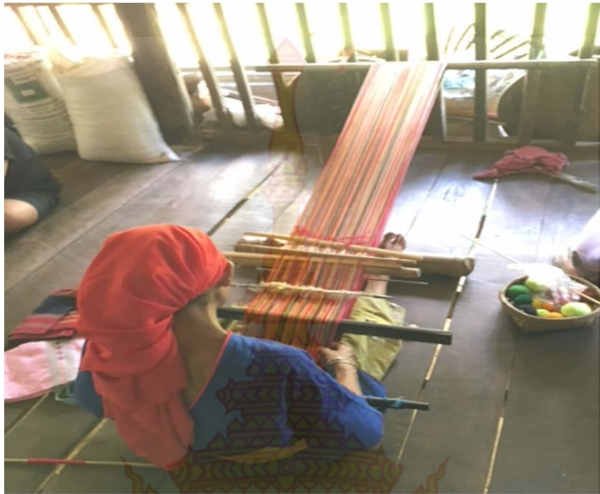
ภาพที่ ก.11 กระบวนการ ขั้นตอน การทอผ้ากี่เอว ขั้นตอนที่ 2 หมู่บ้านชนเผ่าปากากะยอ ตำบลห้วยสัตว์ใหญ่ อำเภอหัวหิน จังหวัดประจวบคีรีขันธ์ 8 ตุลาคม พ.ศ. 2560