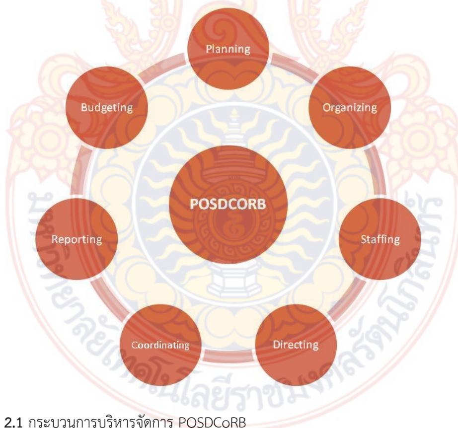
ภาพที่ 2.1 กระบวนการบริหารจัดการ POSDCoRB